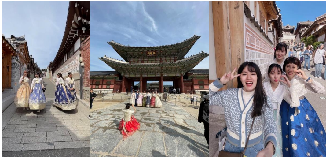
景福宮穿韓服體驗