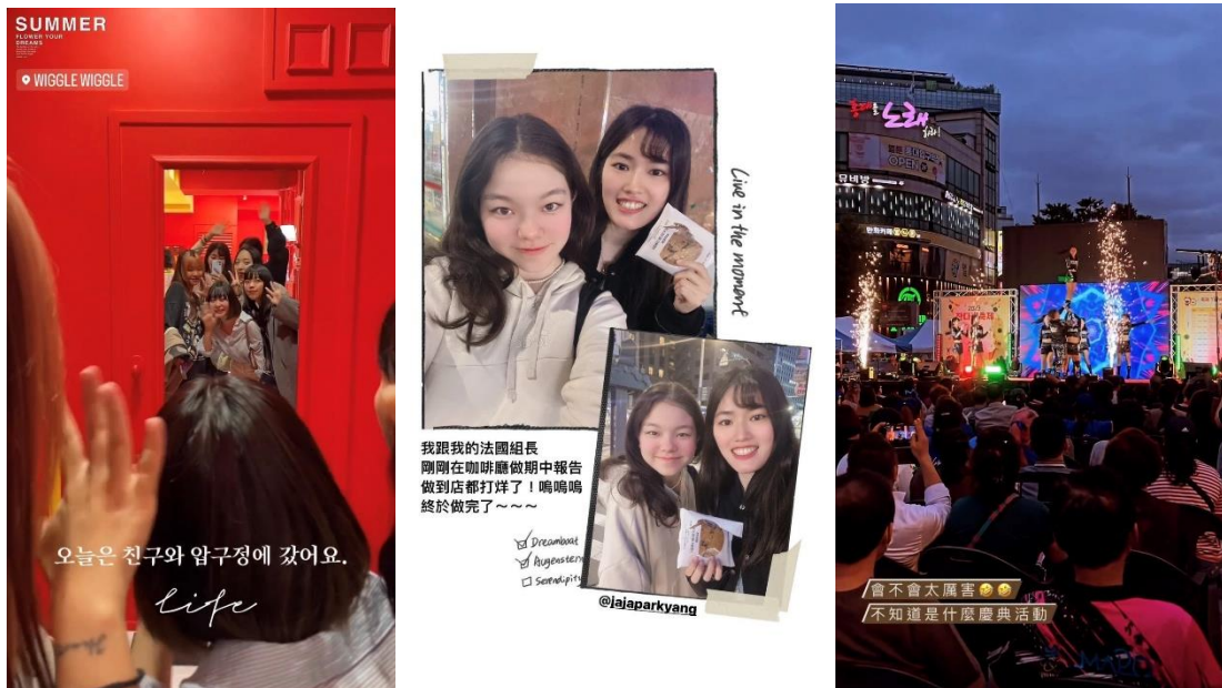
與社團認識的外國朋友去狎鷗亭、弘大看表演