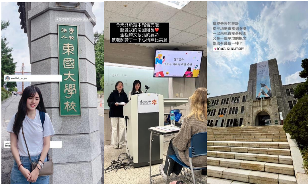
東國大學校園環境以及上課狀況