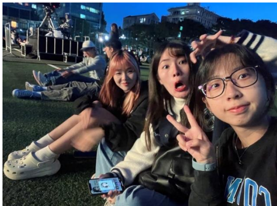
東國大學校慶活動，有邀請藝人表演