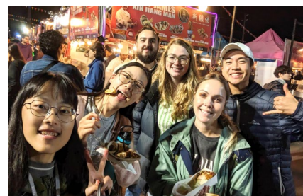
和當地朋友參加夜市活動