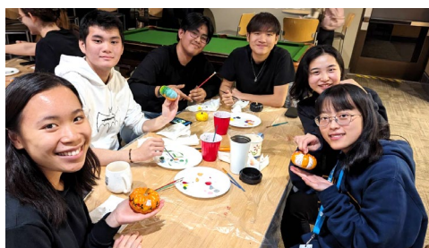
參加宿舍舉辦的節慶活動，認識新加坡、日本、澳洲朋友