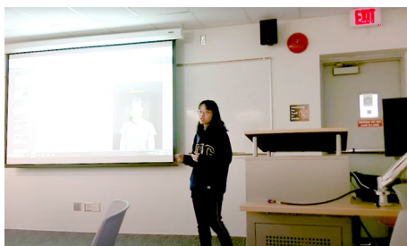
課堂報告執行的藝術專案