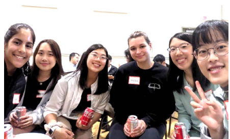
參加學校社團活動