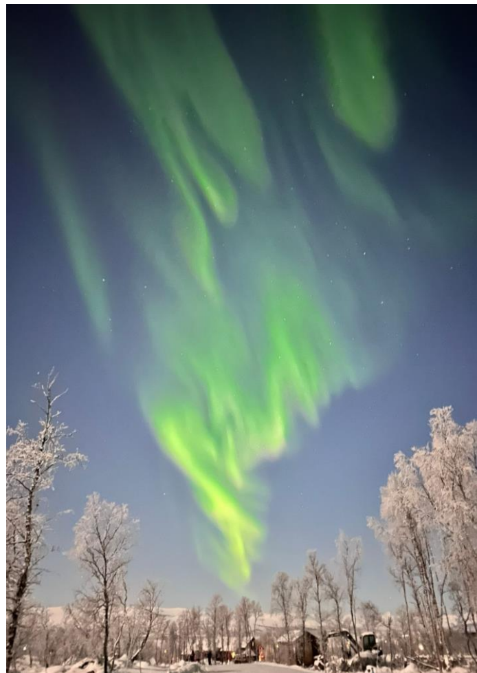
▲在 Lapland 看到的極光