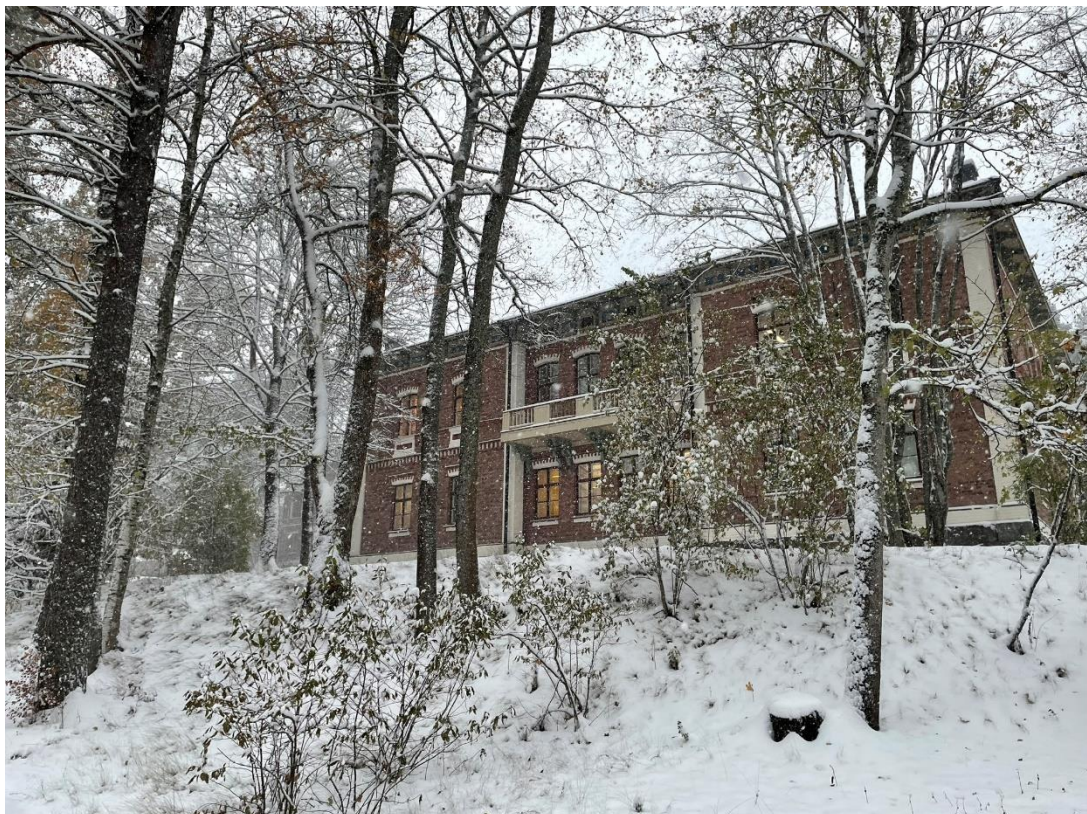
▲冬天第一場雪的校園