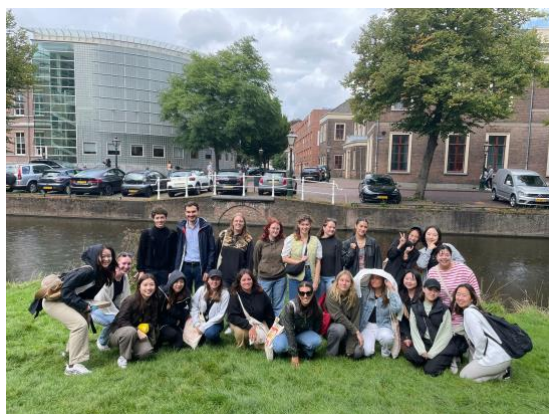
萊頓新生週的組員