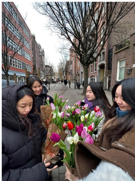
一月的國家鬱金香日