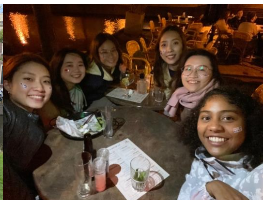
在荷蘭慶祝台灣國慶