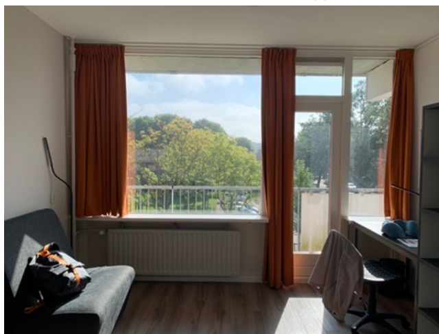
De Zeven Provinciën 68 A 棟房間