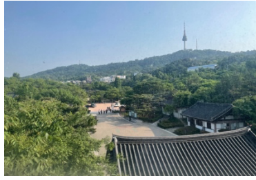
忠武路宿舍廚房窗外風景