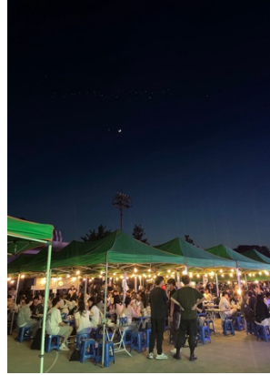
慶典期間校內概況