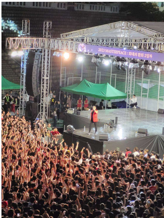
慶熙大學校慶活動：PSY、(G)I-DLE