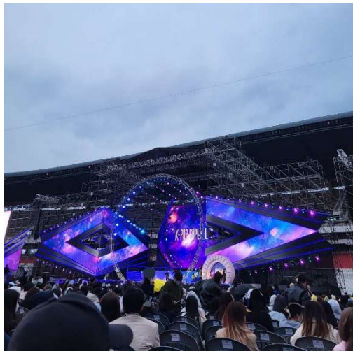
SEOUL FESTA 開幕式演唱會