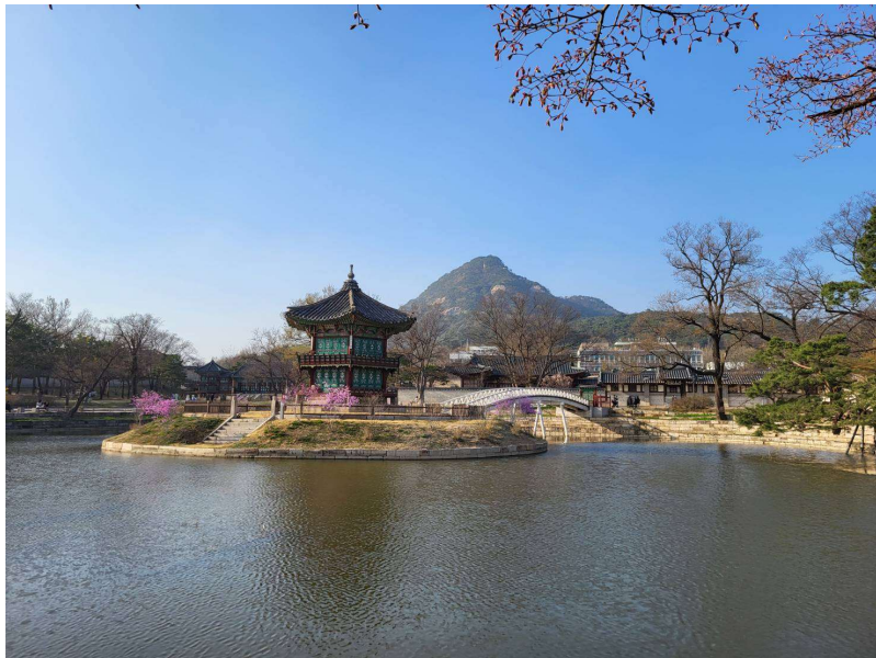
景福宮內也有櫻花盛開