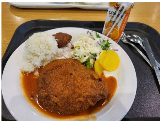
慶熙青雲館 B2 學餐