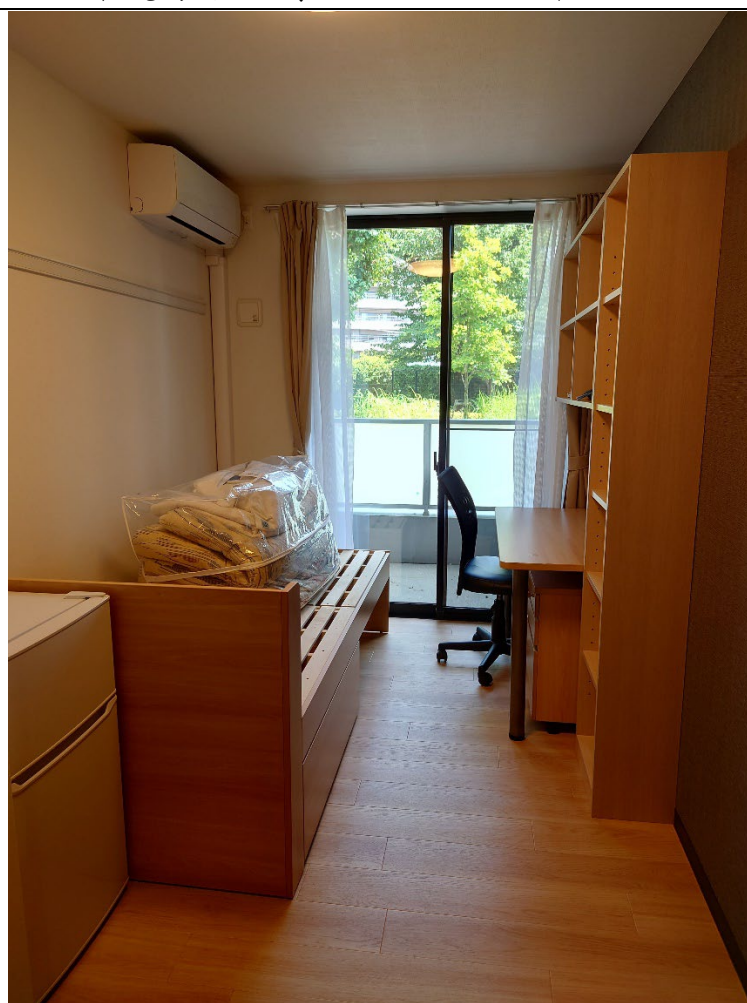
明治大学グローバル・ヴィレッジ中個人寢室