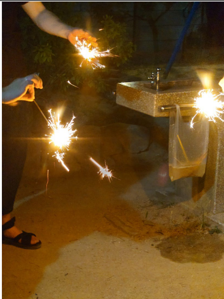
與日本同學一同體驗夏日的手持煙火