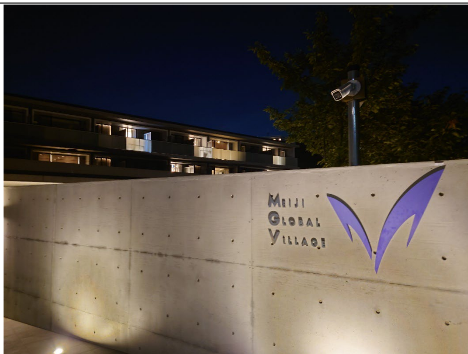
夜晩的明治大学グローバル・ヴィレッジ