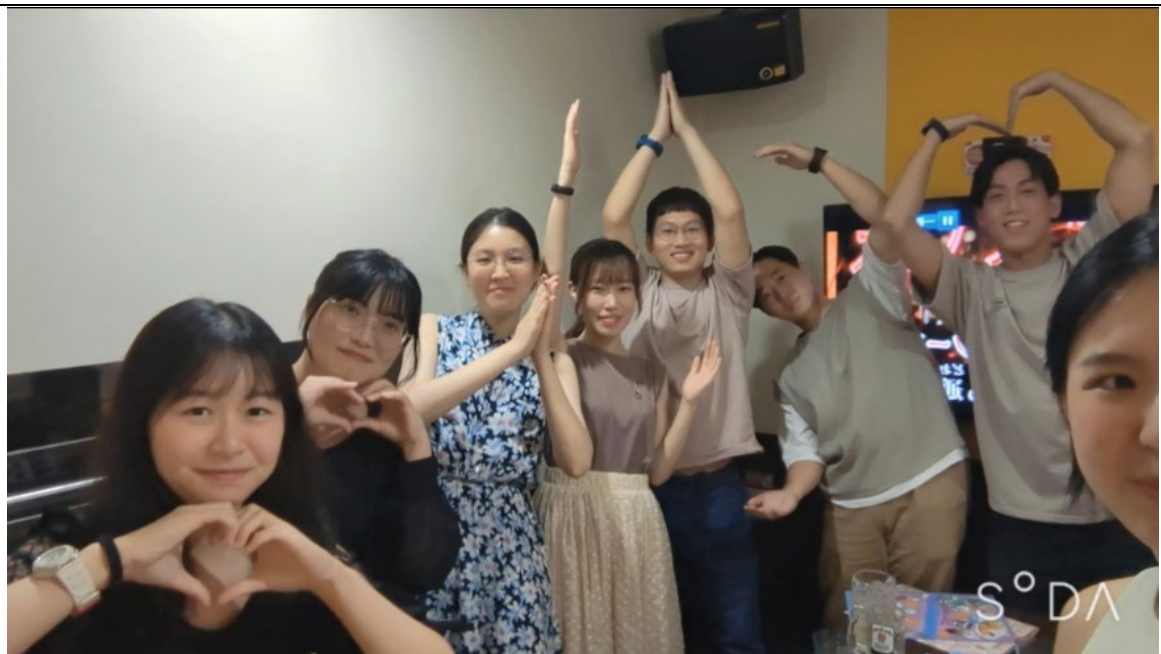
與日本明治大學的臺灣人留學生會的聚會