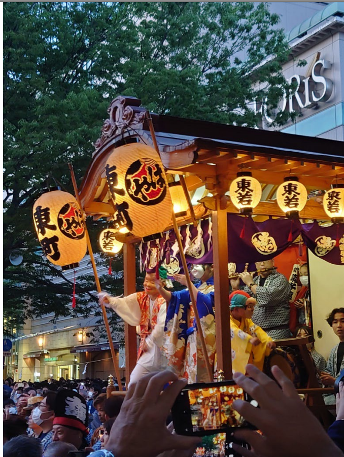
位於東京府中的「くらやみ祭」，可以看到山車（だし）遊繞該神社庇佑的區域