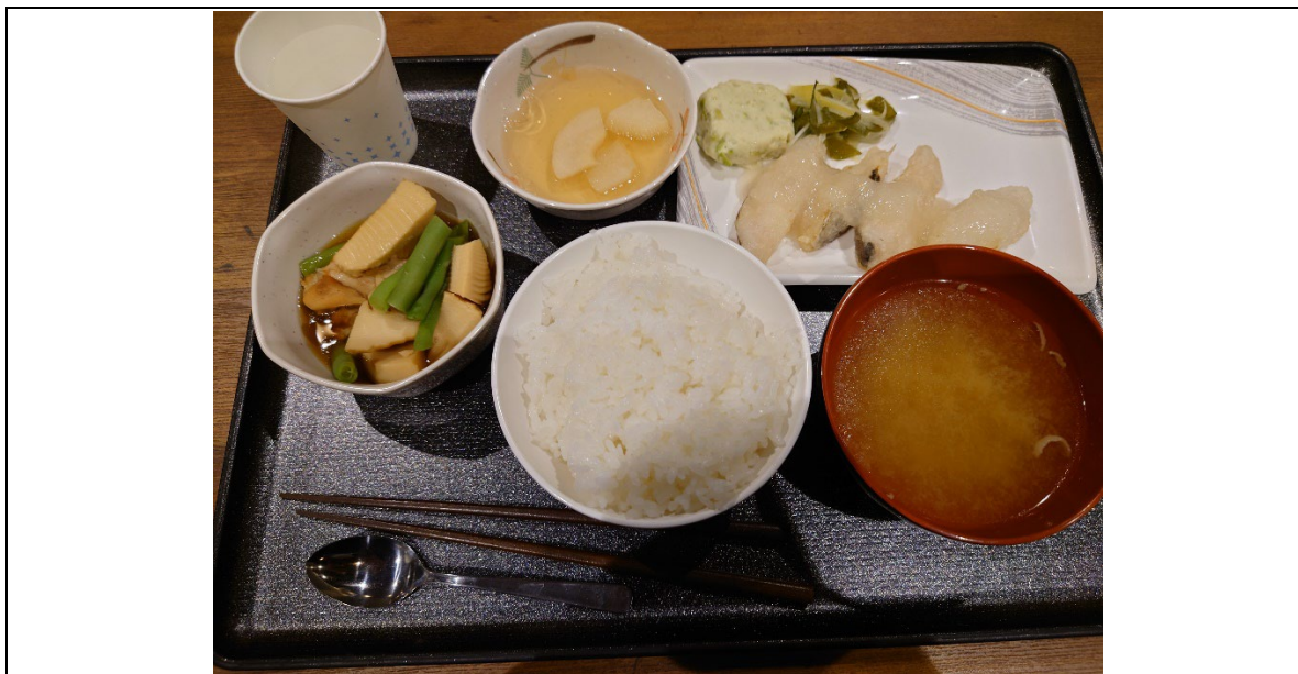
明治大学グローバル・ヴィレッジの毎日供餐