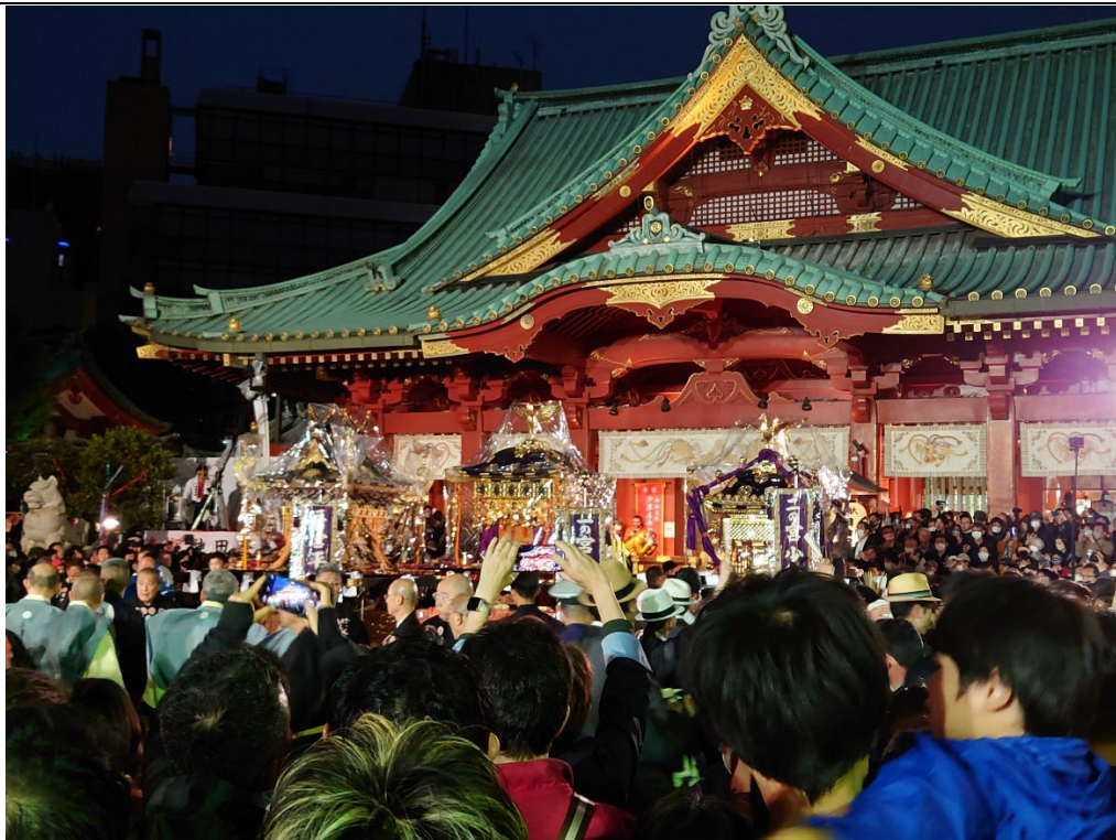
日本三大祭典「神田祭」之傳統行事