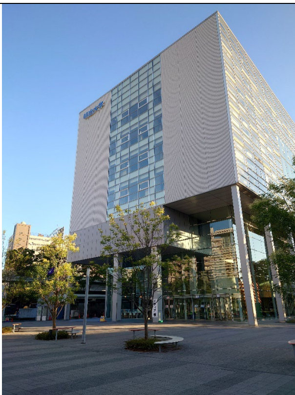
明治大學和泉校區的メディア棟 （商學部1、2年級課程皆在這個校區上課， 距離明治大学グローバル・ヴィレッジ相當靠近）