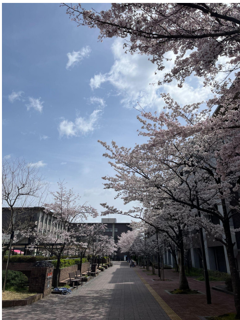
春天的立命館大學