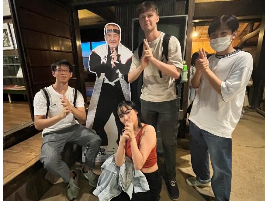
(兵庫縣有馬溫泉；滋賀縣忍者之里)