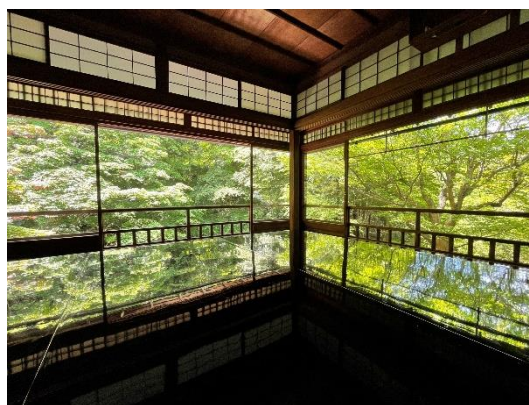
（到奈良縣橿原市今井町の醬油工廠見學；京都府的琉璃光院）