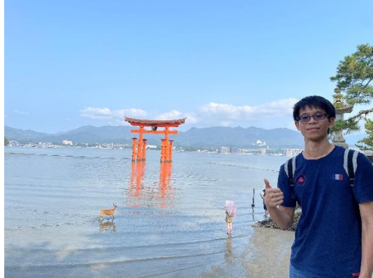
(和歌山縣青岸渡寺；廣島縣嚴島神社)