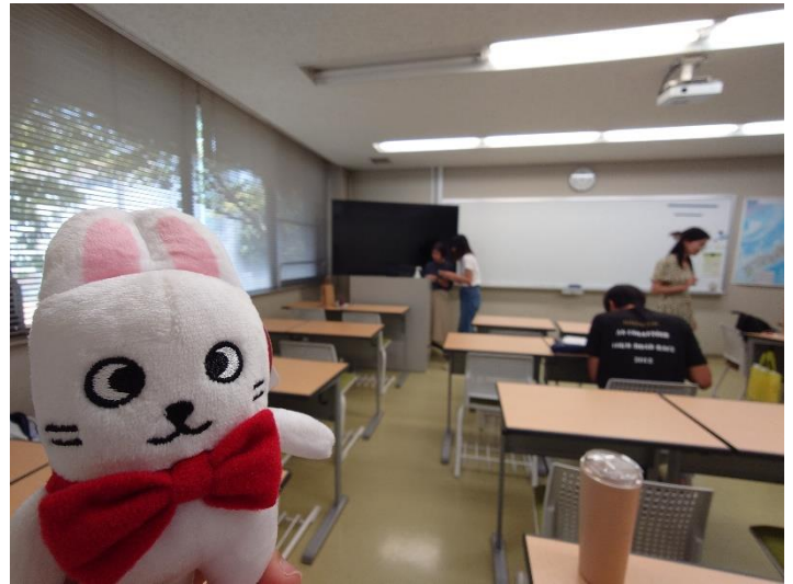
(左上)國際教育中心的大講義室