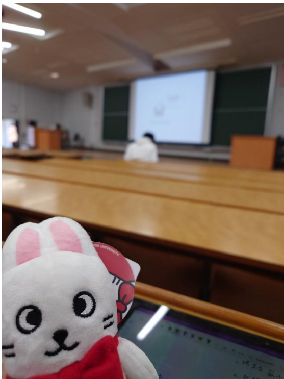
L棟(文學院)的某一間教室，(右下) 前面有一台可以把照到的物品投射到螢幕上的機器