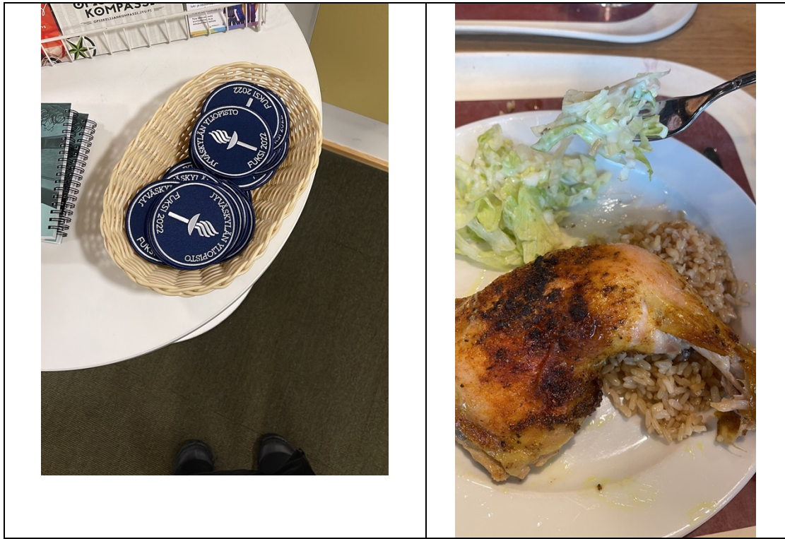
參與活動可獲得的徽章