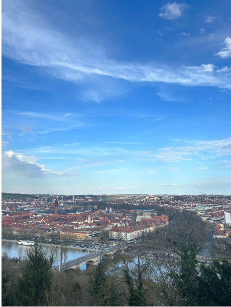
符茲堡(從城堡眺望)