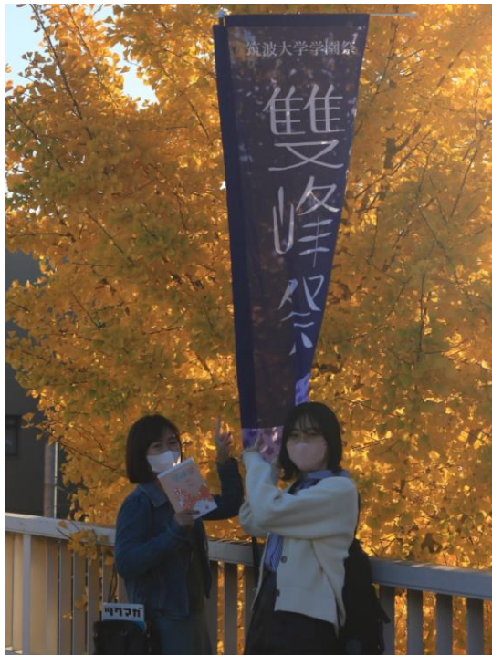
雙峰祭與11月的銀杏