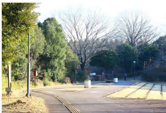
從宿舍到教室會經過的道路