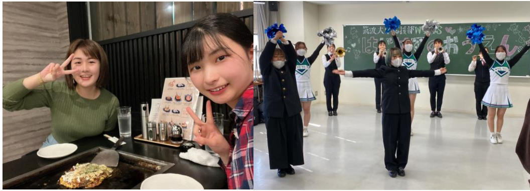
和 Tutor 一起吃飯