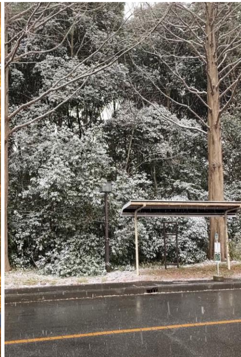
難得一遇下雪的筑波