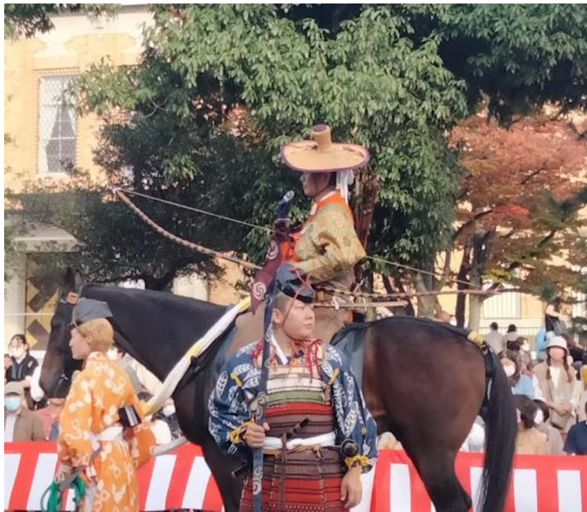
2022 年 10 月 22 日，有幸參加時代祭。(從京都御苑出發到平安神宮) 另外，二月初時，也參加了節分祭，搶到了驅趕鬼用的福豆！