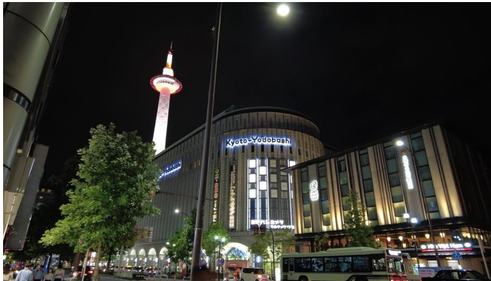
剛抵達時，京都車站的附近(京都塔和明月)。