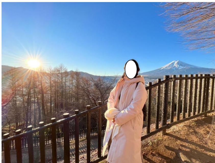
聖誕假期去了山梨，2023 年初第一天遠眺富士山和日出。