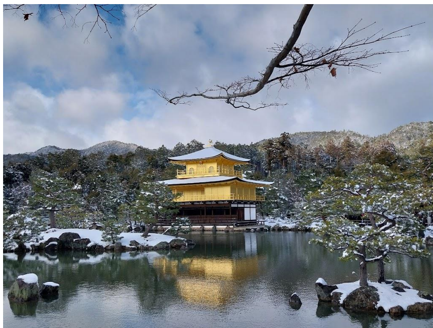
金閣寺離學校大概只需要 20 分鐘步程，有幸目睹難得一見雪金閣。