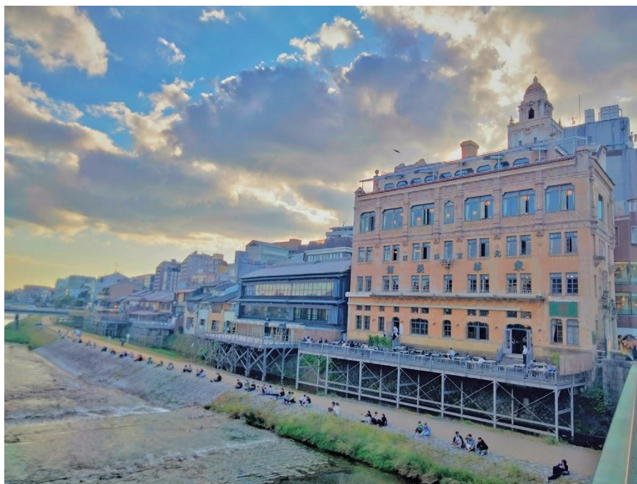
四條河原町旁的鴨川，常有情侶、友人、家庭坐在川邊野餐聊天。