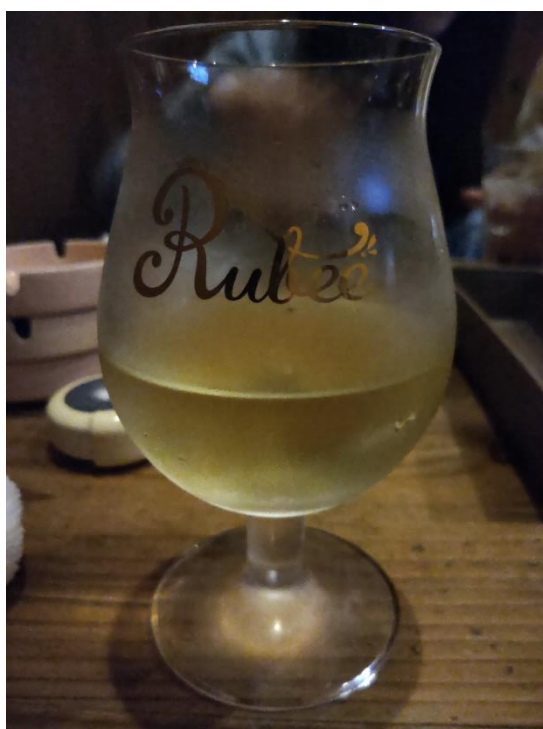
圖三、便宜好吃的居酒屋