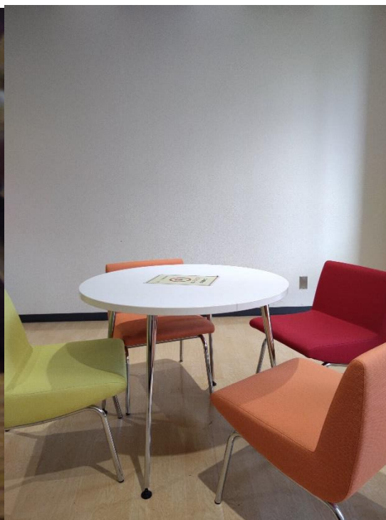
圖四、留學生中心外面