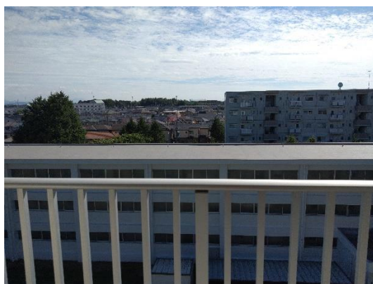
圖一、五樓寢室看出去的風景