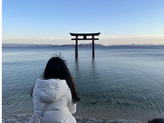
琵琶湖白鬚神社鳥居前