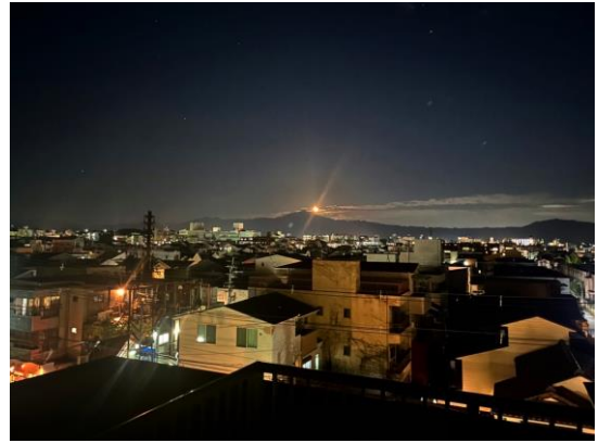
從大將軍宿舍頂樓看月亮升起