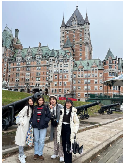
去 Quebec 旅行