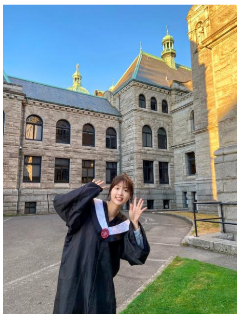
Victoria Parliament House