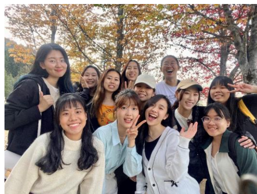
去 Whistler 旅行