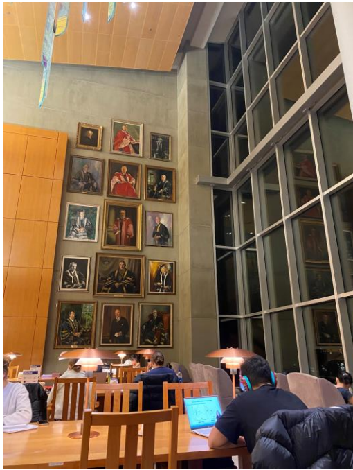
在 IKB 圖書館讀書