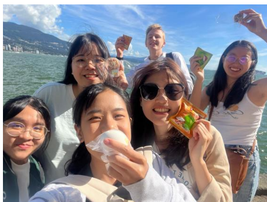
去 Stanley Park 騎車, 分享家鄉小零食