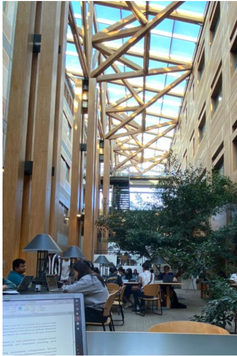
在 Faculty of Forest 讀書