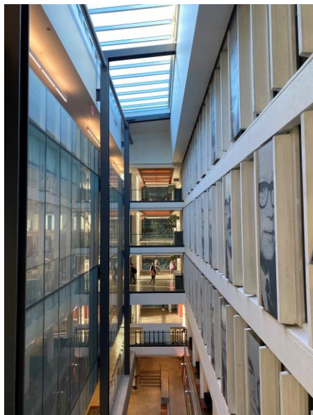
UBC Sauder 商學院