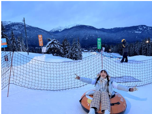
在 Whistler 玩 Tubing