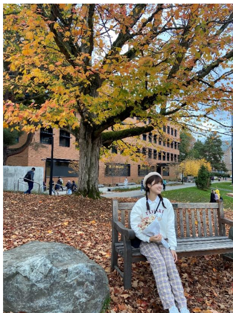
University of Washington (Seattle)