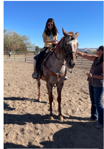
▲去朋友家的農場體驗騎 馬，他們家是自給自足，吃 自己養的雞跟蛋、吃自己種 的蔬菜水果，超酷的！