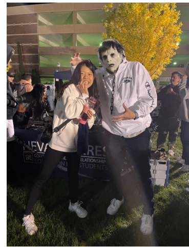
▲大家都很熱衷萬聖節， 被這個路人嚇到！