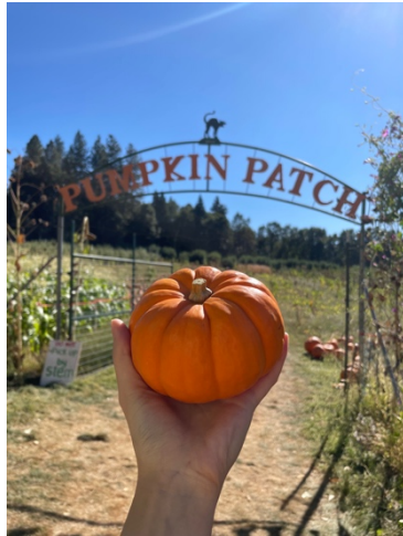
▲秋天是南瓜的季節