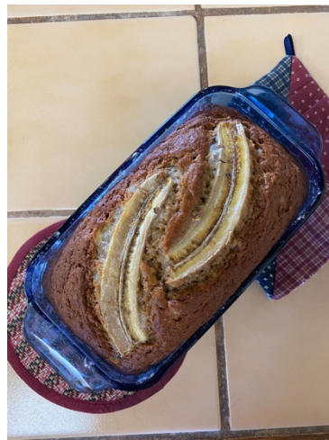
▲烘焙日常： 香蕉麵包