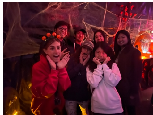
▲萬聖節去鬼屋自己