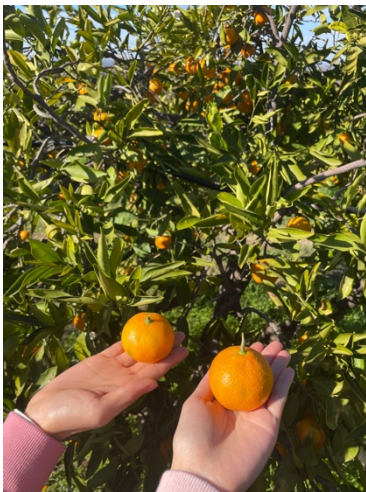
▲陽光加州的橘子園