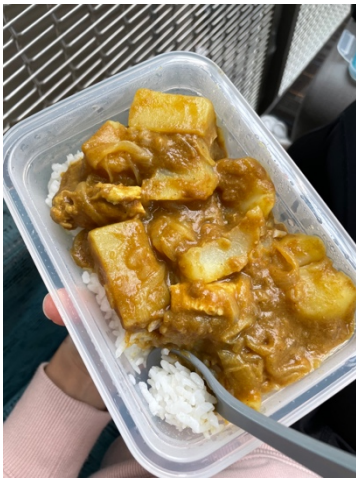
▲平時自己帶便當， 在校園找個地方吃飽 然後找空堂唸書