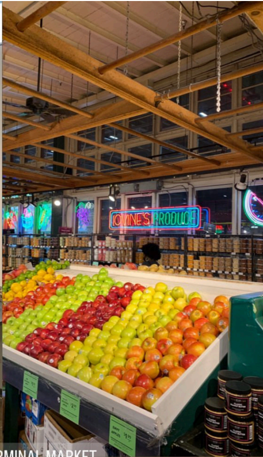
READING TERMINAL MARKET