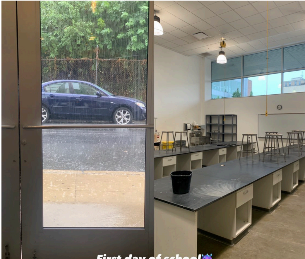
First day of school 🌧️