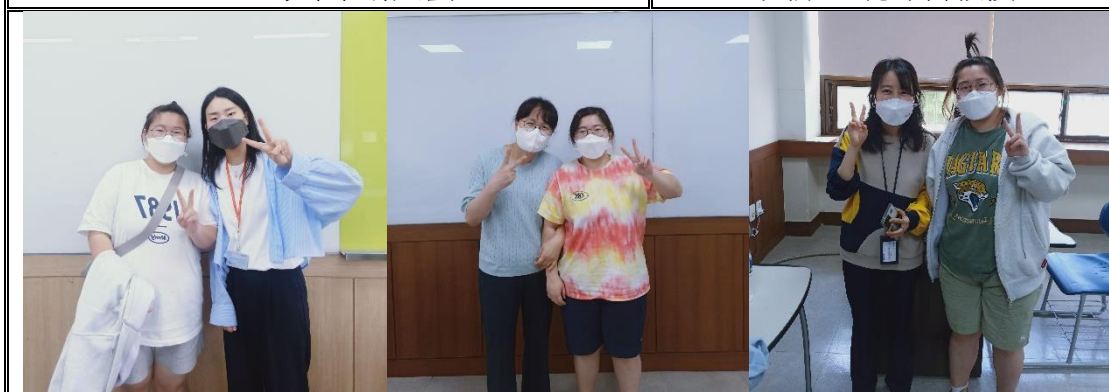
與語學堂老師合影