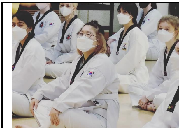
語學堂文化課: 跆拳道