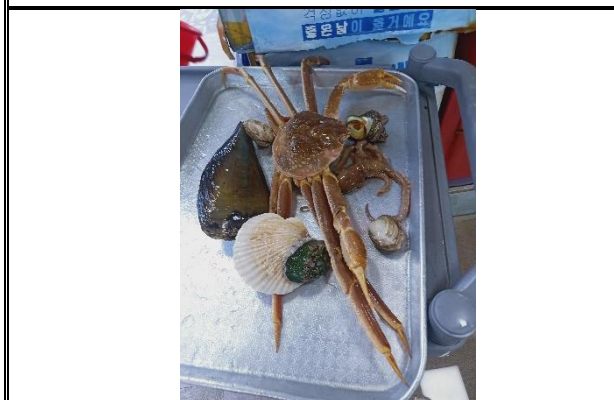
釜山海鮮市場大蟹