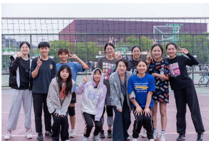
數學生科女排聯隊合影

感謝南京大學，感謝台港澳交流協會以及學伴團，希望所有在這相遇的人們，都能不負青春韶華，勇敢追夢，未來在更高處相見！