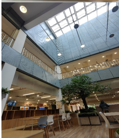
圖 2：北區食堂內部照片

本部共有三個食堂：北區、本部、邯鄲，離宿舍最近的是剛翻新的北區食堂，共有兩層樓，提供中日韓、自助餐、清真等食物，另外還有烘焙、飲料店，價格非常實惠，同樣也是使用學生證進行支付，整體而言選擇非常多，口味也很好吃，環境非常簡潔，隨時有人清潔，還有電視投放可觀看新聞，同時二樓還有公共討論區。