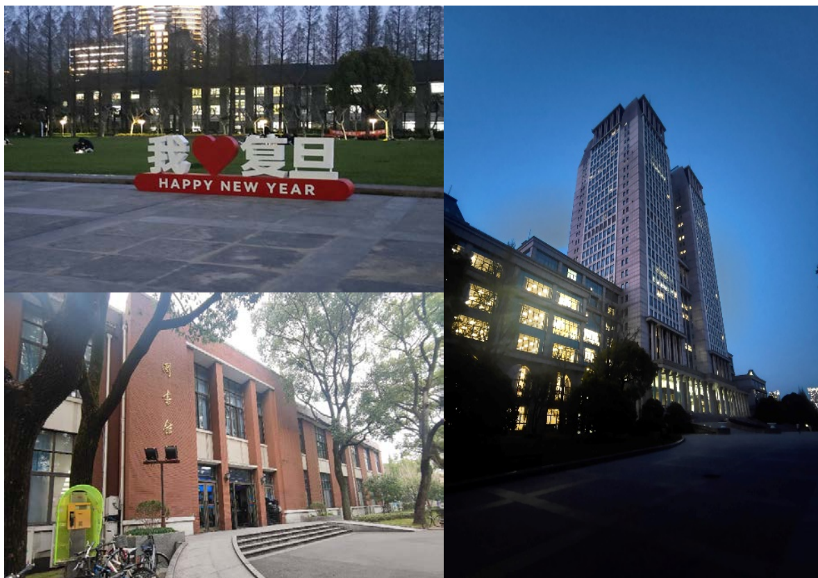
圖 7：光華樓草坪標語(左上) 本部圖書館(左下)光華樓(右側)