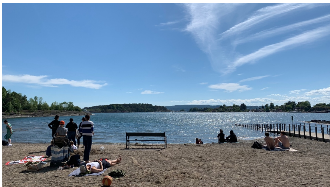
Beach on Hovedøya