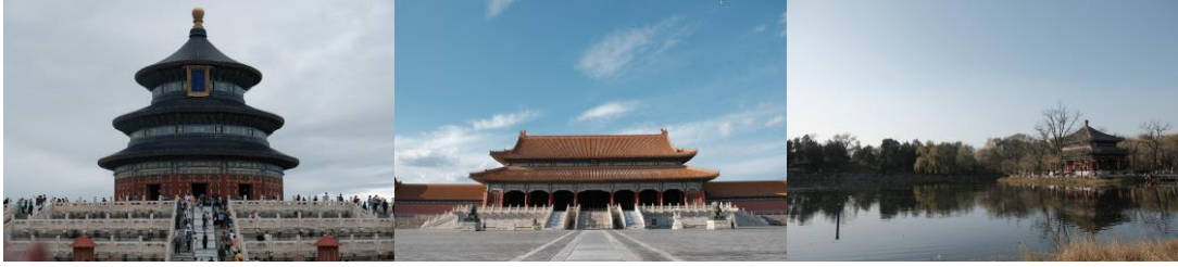
由左至右：天壇、紫禁城、圓明園