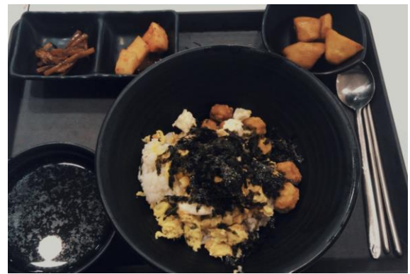
Korea Club 活動 - 南大門