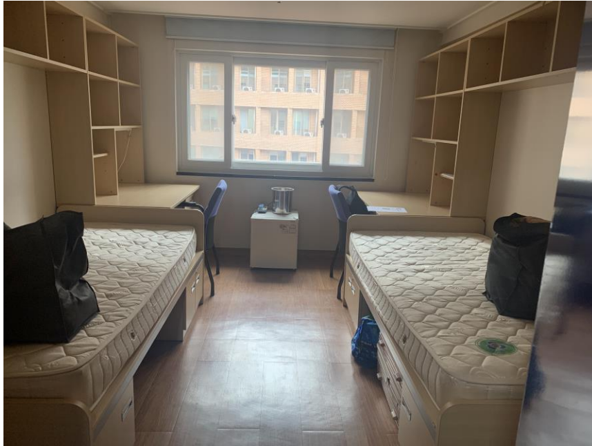
延世 I House 宿舍