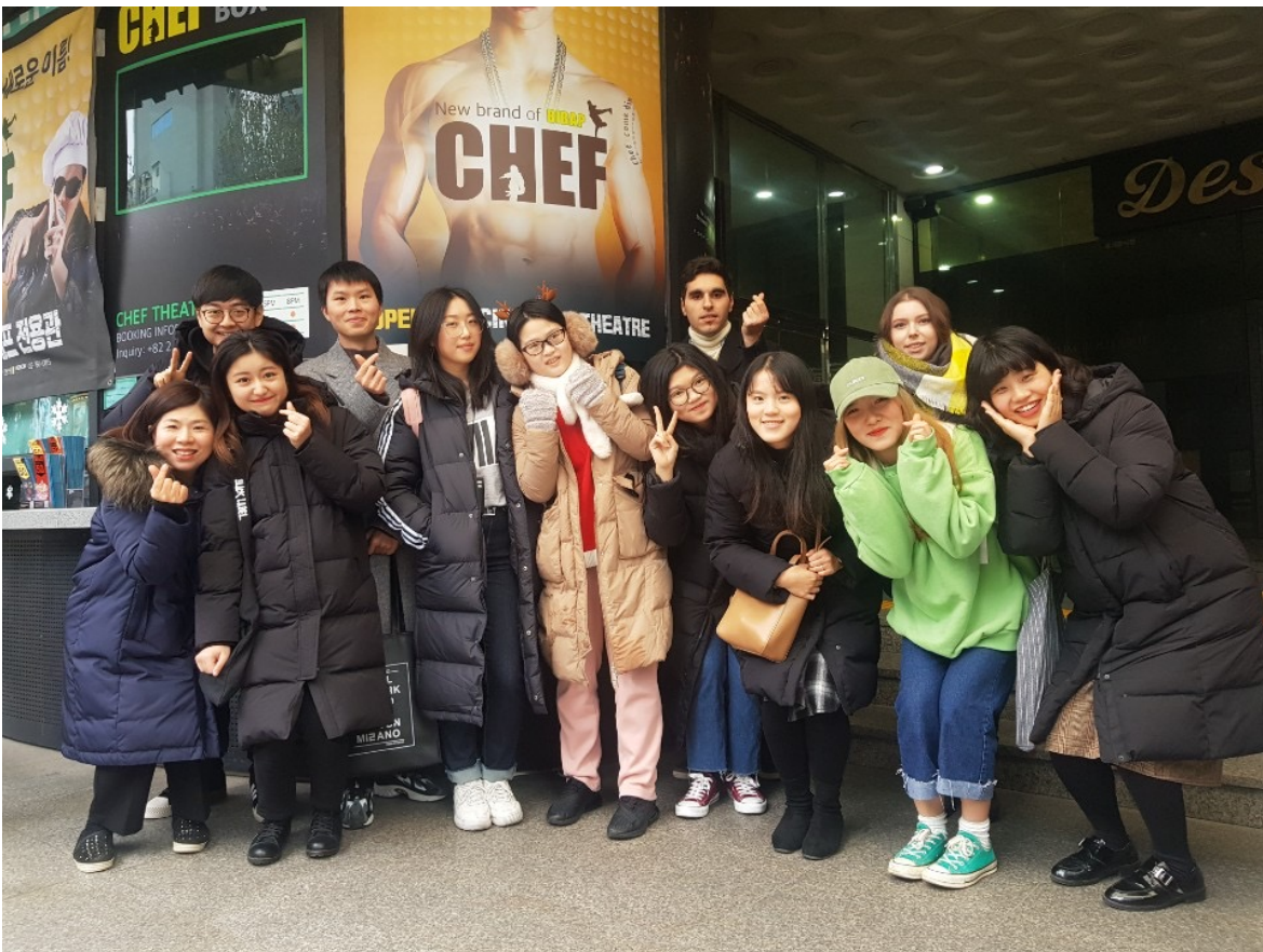
↑ 語學堂五級文化體驗：觀賞拌飯秀（一班共14位學生）