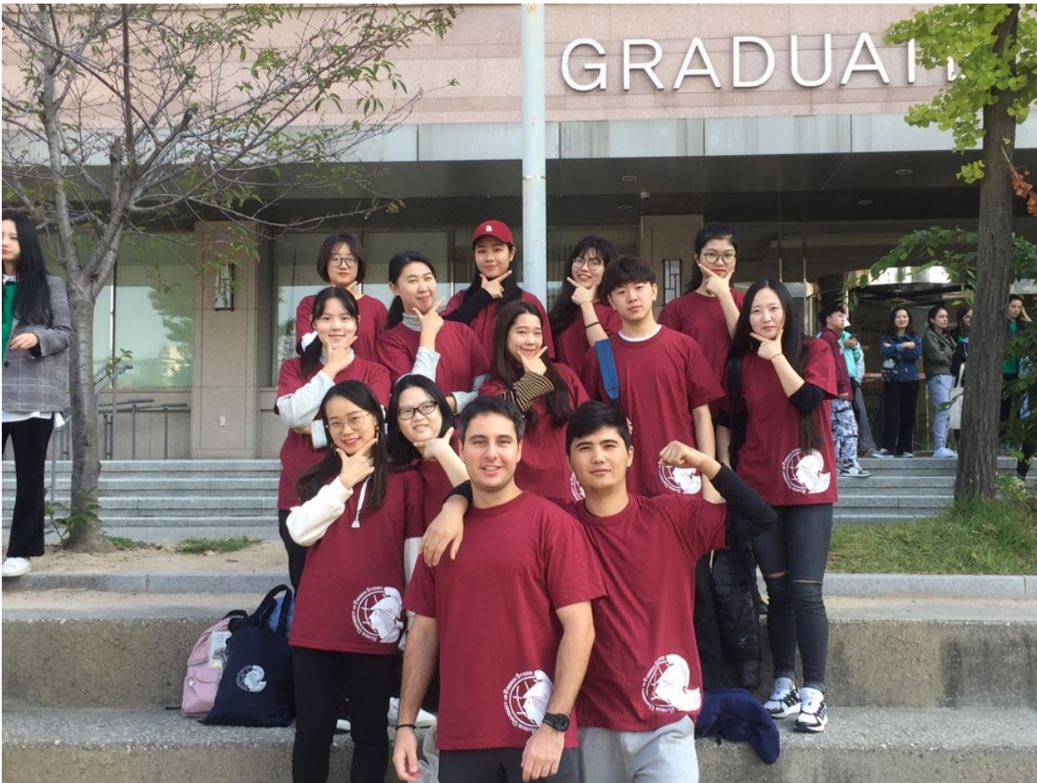
↑ 語學堂四級文化體驗：秋季體育大會（一班共14位學生）