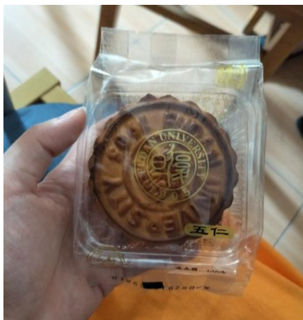
中秋節時 印有復旦校徽的月餅