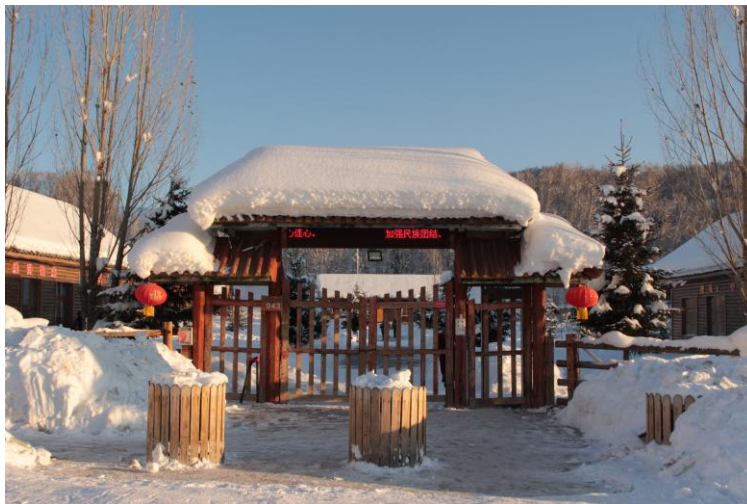
村裡唯一的小學門口