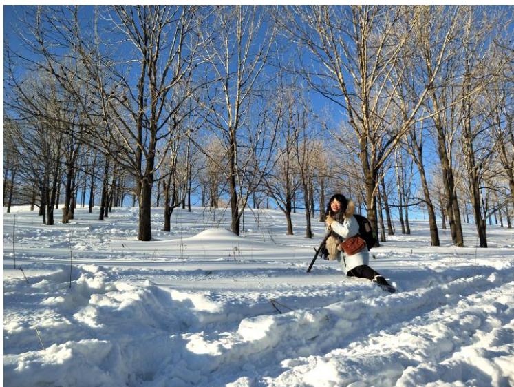
雪地徒步穿越 15 公里