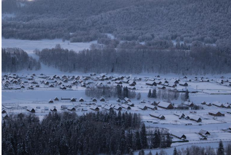
北疆靜謐的小村落