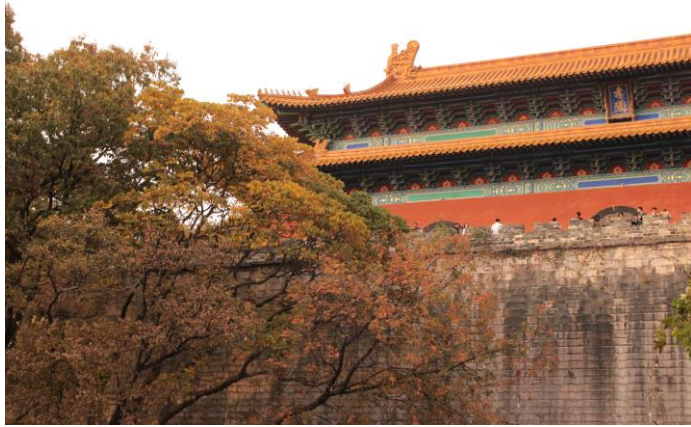
一片秋意的南京明孝陵