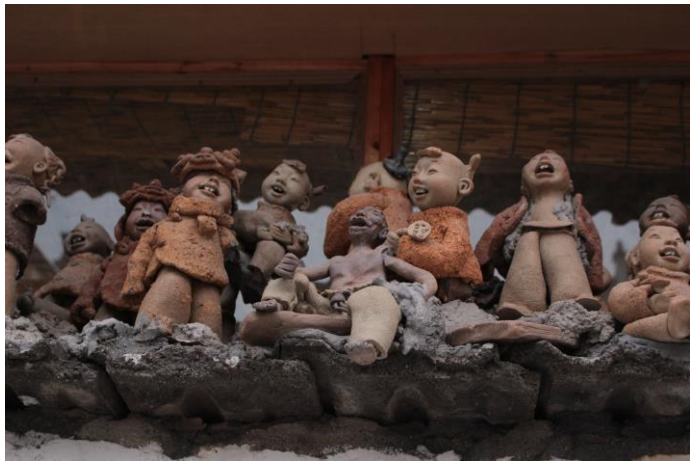
景德鎮人家的牆上陶藝裝飾