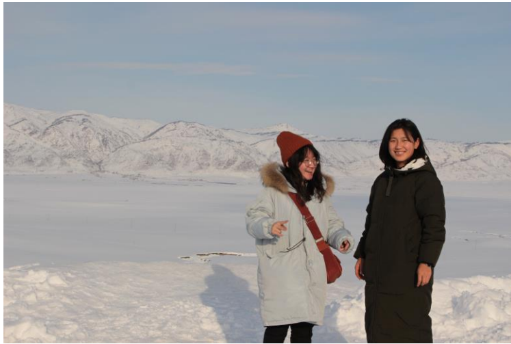
在新疆認識的女孩