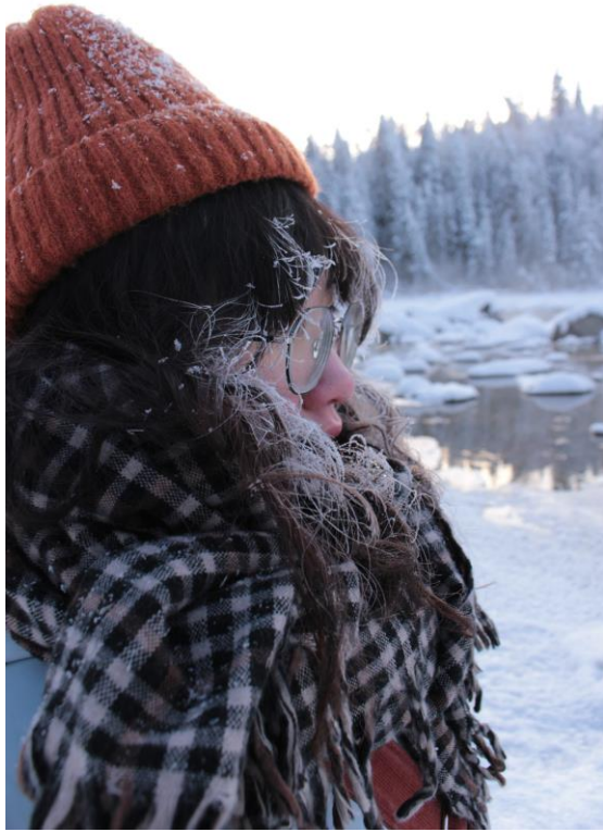
零下 20 度髮上結霜