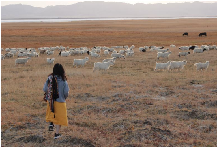
青海路上遇見的羊群們