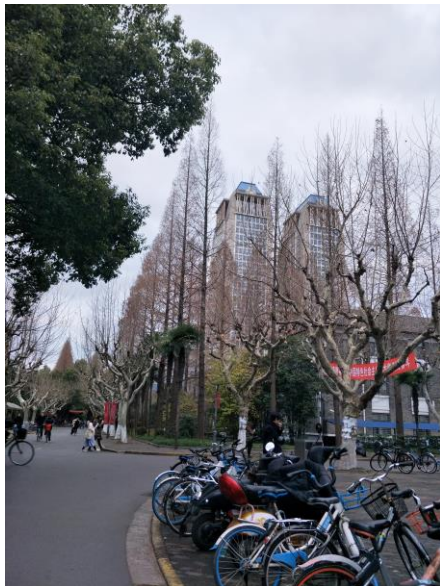
校園中 後面是校園代表性建築光華樓