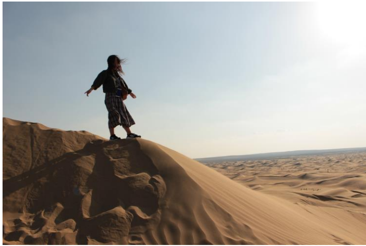
內蒙古庫布齊沙漠