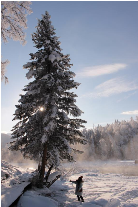
處處都是高聳的聖誕樹