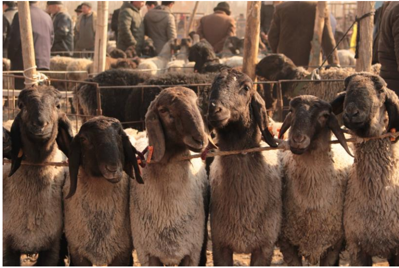
新疆喀什牛羊市集