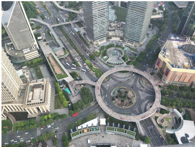
從東方明珠向下望去的上海都會