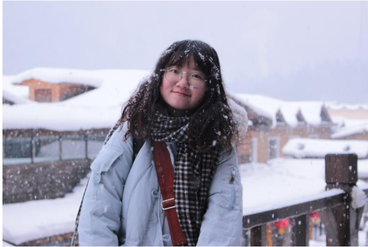
在哈爾濱遇見的第一場雪