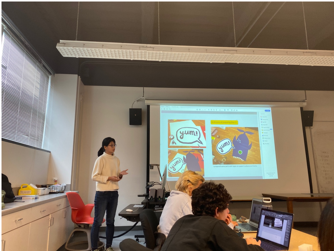
設計課的課堂報告