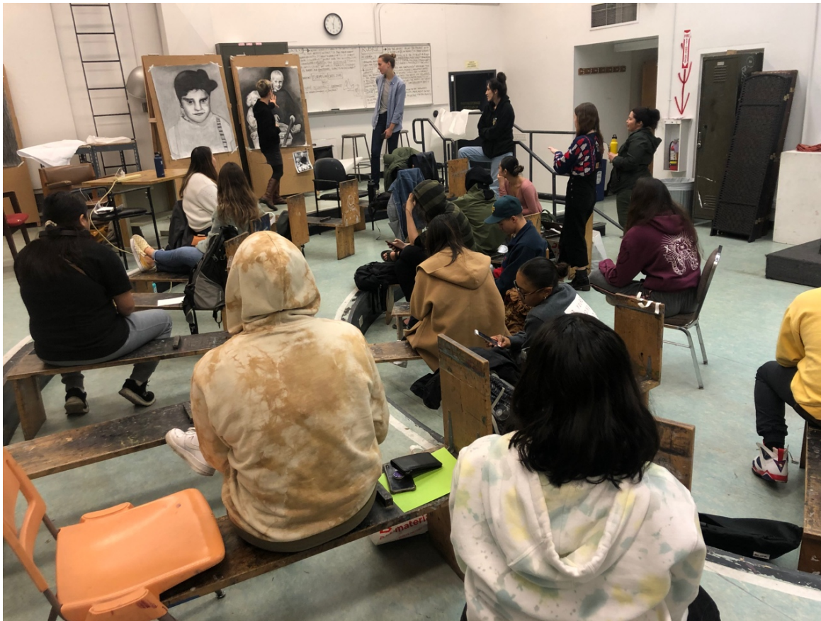
素描課的評圖場景