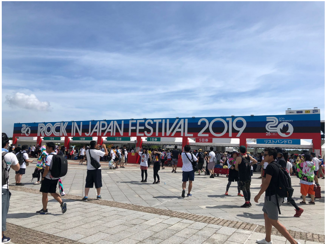
音樂祭 ROCK IN JAPAN(位於茨城縣)