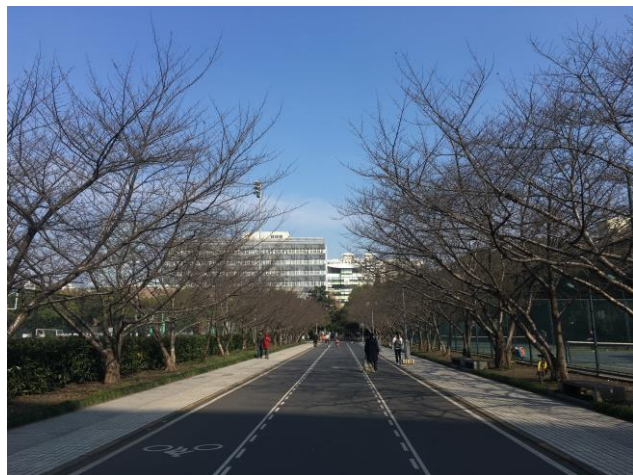
同濟大學很有名的櫻花大道，每年春天盛開滿滿。即使沒有開花，也是很美麗！