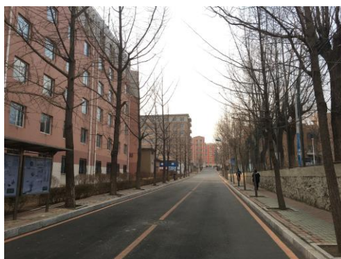
西山生活圈中的一條路