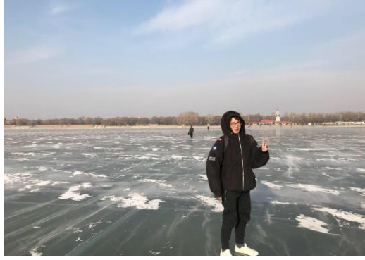
結冰的松花江（哈爾濱）