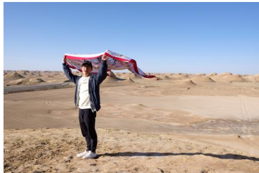
雅丹地形（甘肅敦煌）