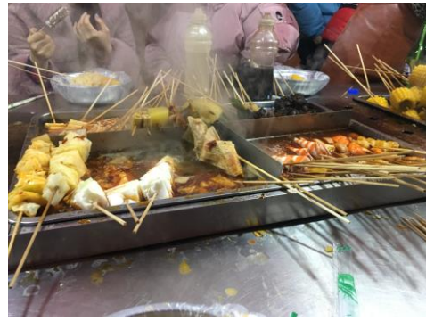
哈師大夜市的串串（哈爾濱）