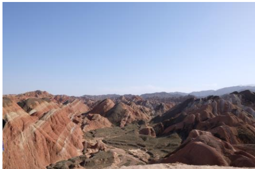
張掖七彩丹霞 (甘肅)