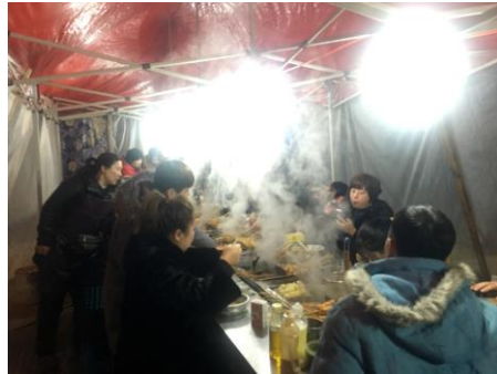
哈師大夜市的串串（哈爾濱）