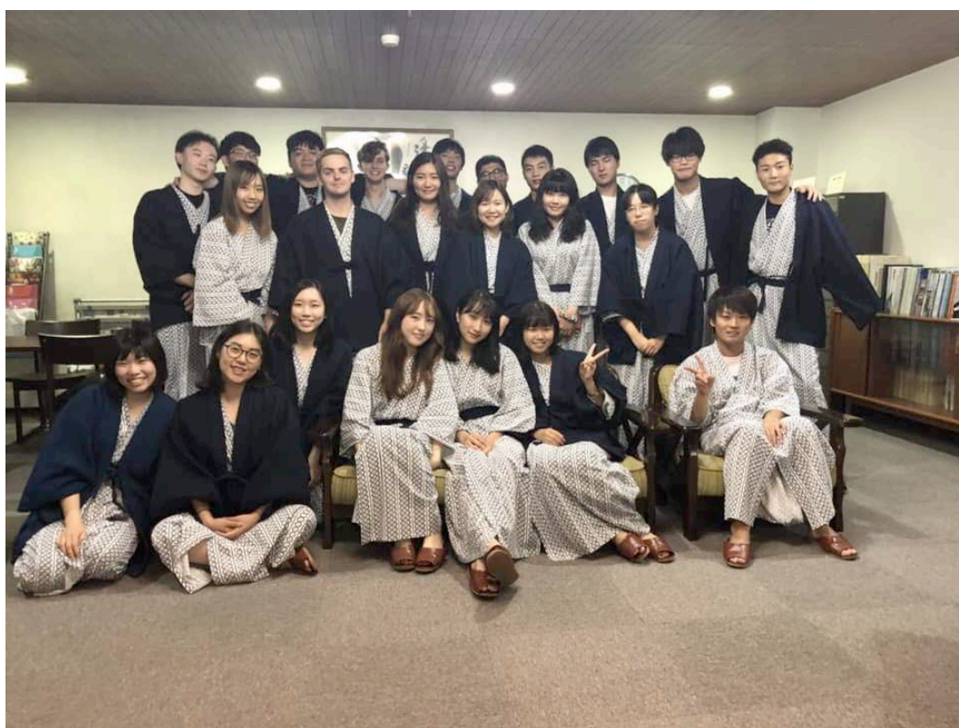
與日本同學的神戸出遊