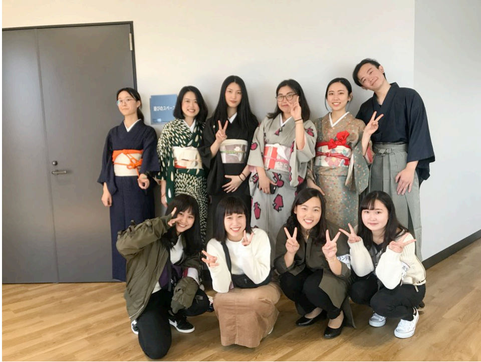
大阪留學生國際茶會