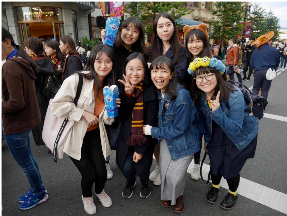
與日文同班同學去 usj