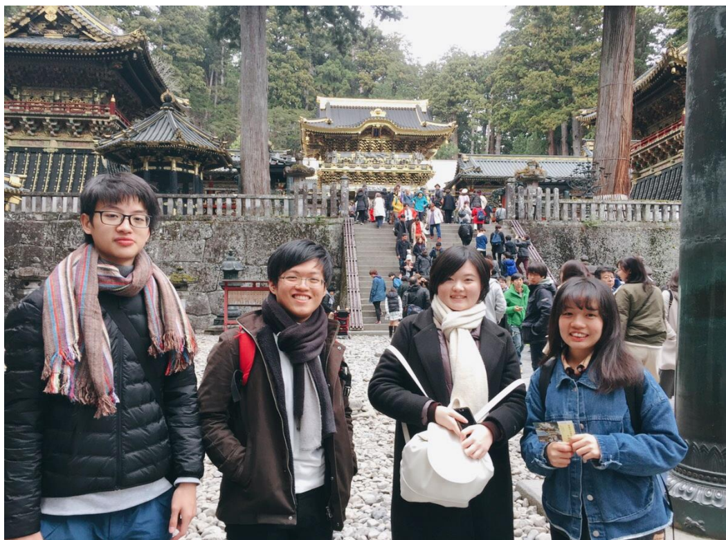
日光東照宮。日本朋友為我們詳細講述了每個建築物的由來，是一個了解了歷史根源而非走馬看花的旅程。