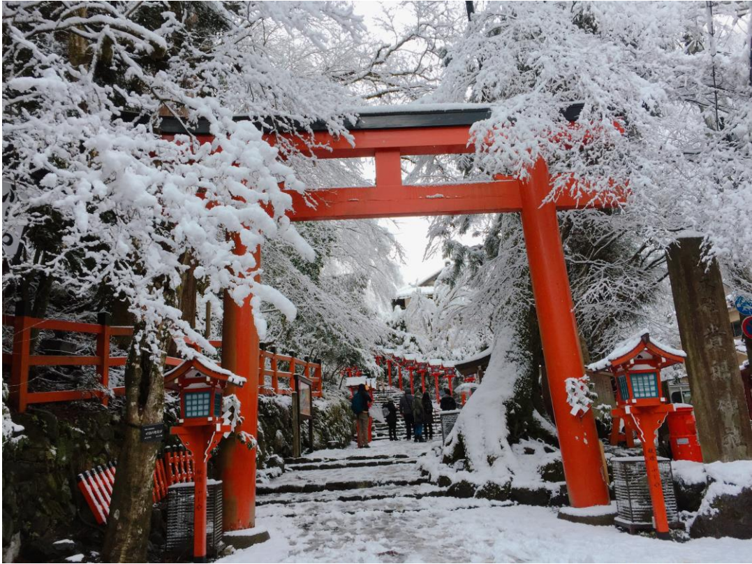
這是京都的貴船神社。也是我在日本看到的第一場雪。下雪的貴船神社非常美麗，裡面的水占卜也很有名。