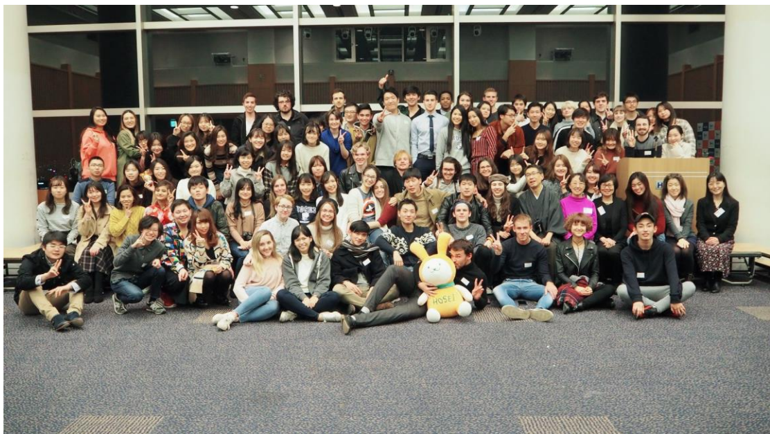
這是學期最後一天的歡送會，大家一起吃披薩、看留學生們的表演。最後拍了紀念照，是很美好的回憶。