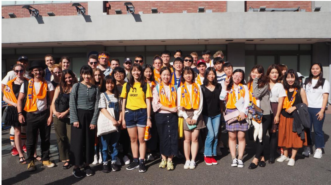
由於場內禁止拍照，因此這是比賽後留學生在場外的合照，順帶一提，法政睽違了六年贏得了優勝！