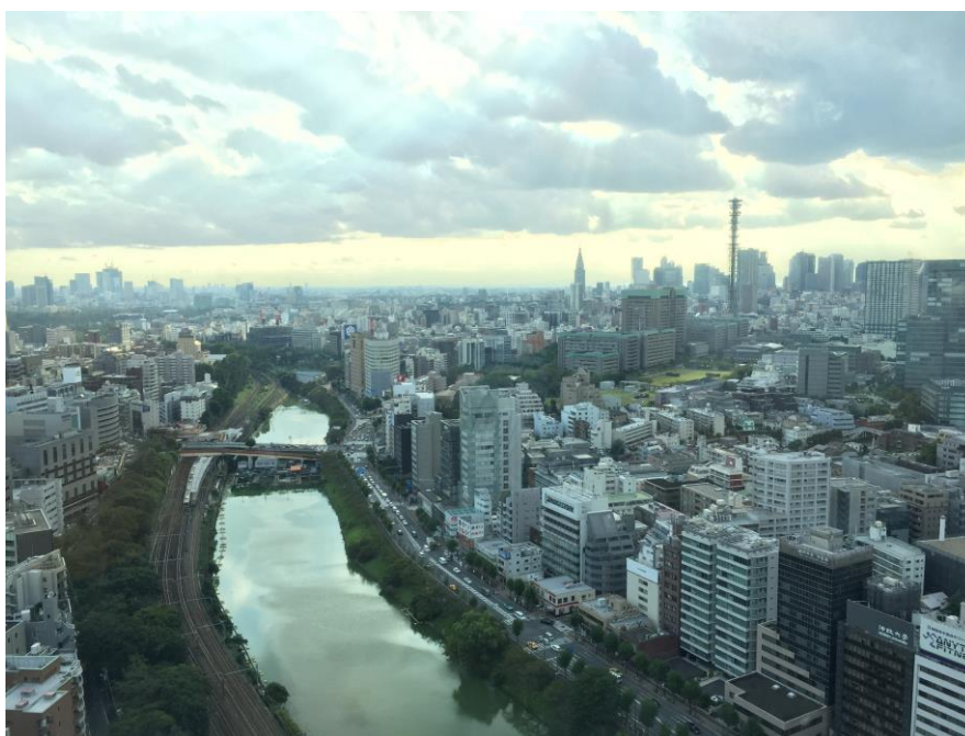
這是從法政のボアソナード・タワー最頂樓 26 樓拍的，天氣好時可以看見晴空塔及富士山。