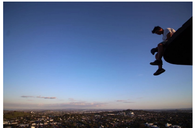
(希望你也有一個難忘的紐西蘭交換生活)