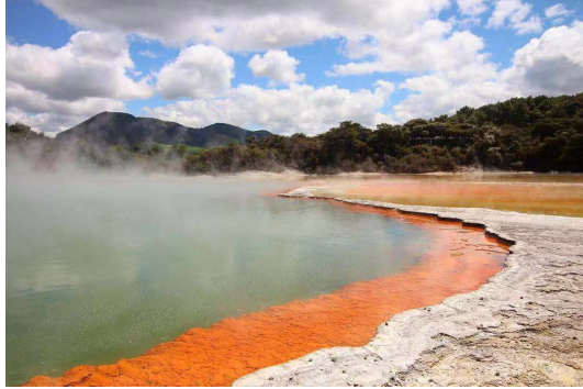
（這是一個很有名的地熱湖）