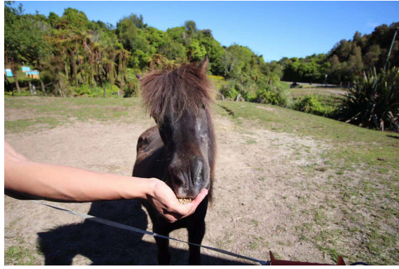
(他們家有養迷你馬)