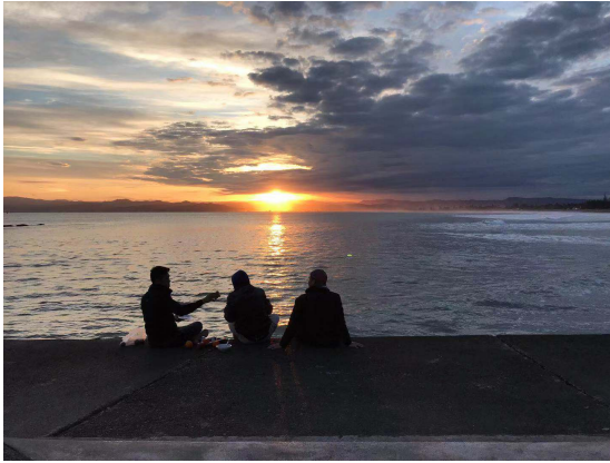
(跟好朋友到海邊看個日落)