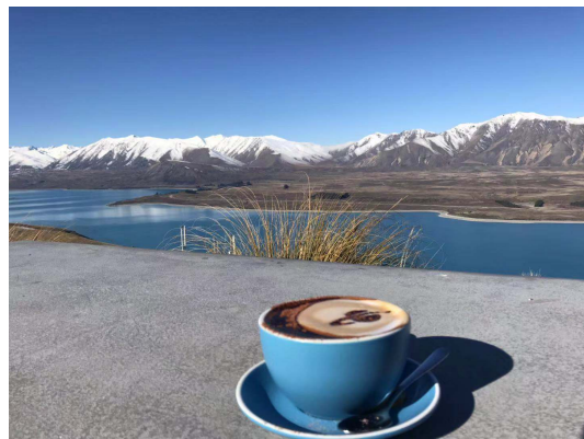
(在這種景色下喝一杯咖啡)