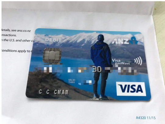
(可以客製化一張屬於自己的銀行卡)