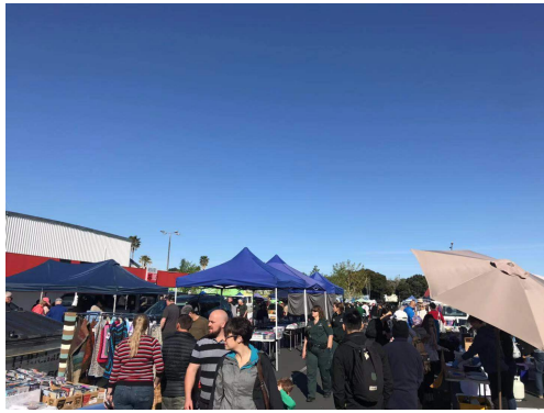
(這是我很喜歡逛的 morning market)