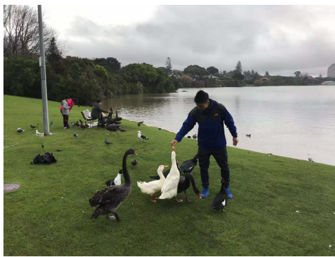
(週末到公園去喂鴨子)