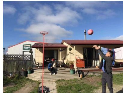
(這一家的前院還可以打球)