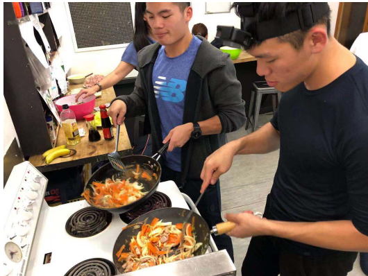
(自己製造晚餐，有趣又省錢)