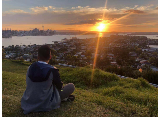
(週末的時候去附近爬爬山)