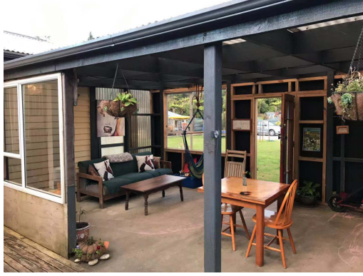
(在 Airbnb 找的房子)