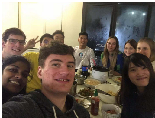
(約個三五知己一起吃，住宿舍的好處)