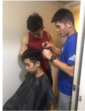
(除了自己煮還可以自己剪頭髮)