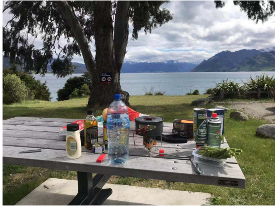
(去旅遊的時候可以直接在戶外野餐)