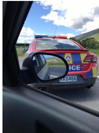
(開車千萬別超速啊，罰得不輕🙄)