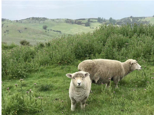
(一個羊比人多的國家)