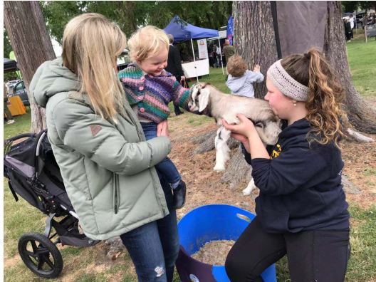
(剛出生五天的羊寶寶，在早市集裡讓人抱)