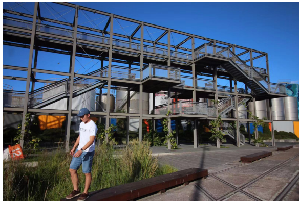
(學校附近的一個工業碼頭)