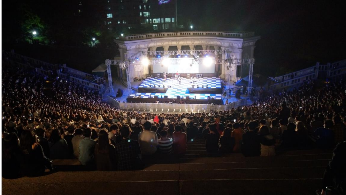
慶熙大學首爾校區祝祭