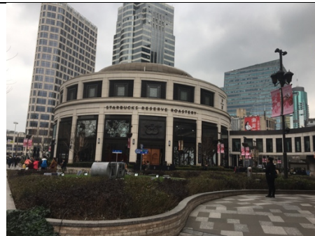
世界最大星巴克 觀光工廠