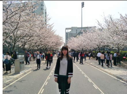
同濟大學櫻花大道