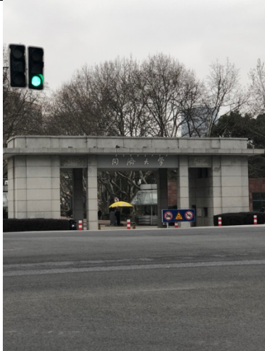
同濟大學四平校區大門