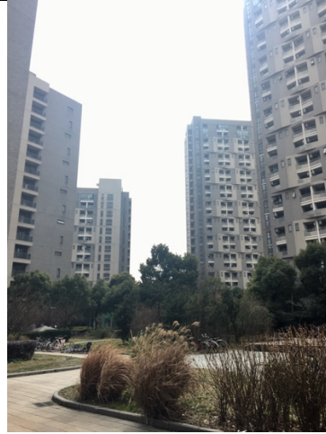
彰武校區宿舍小區