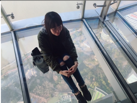
東方明珠透明觀光廊