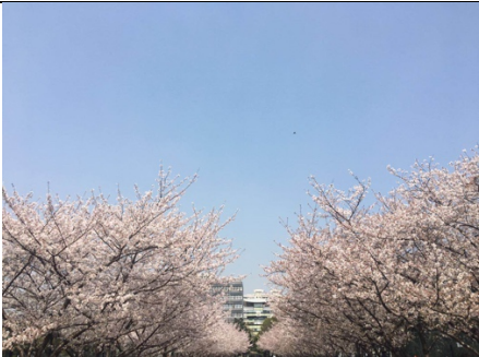
同濟大學櫻花大道