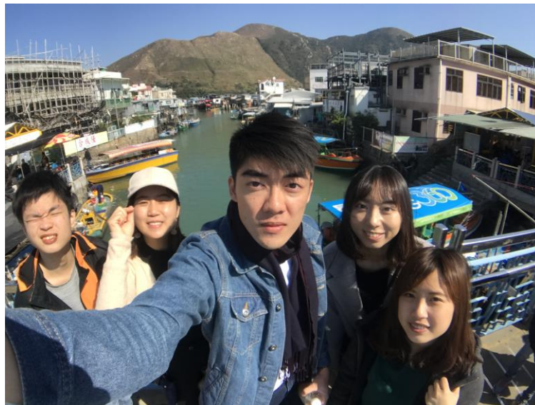
（台灣澳門交換生一起去大澳玩）