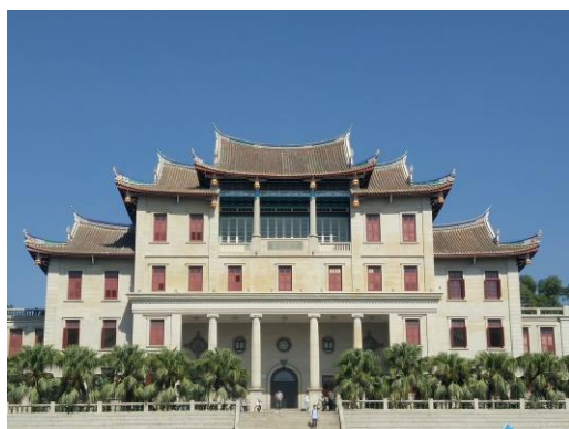
廈門大學 建南大會堂