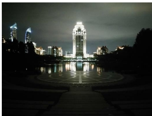
芙蓉湖，頌恩樓夜景