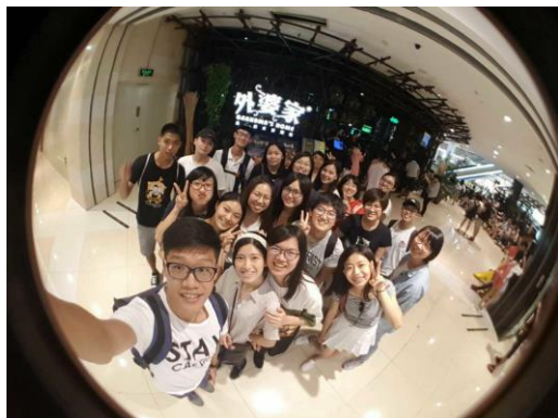
台灣交換生聚餐(外婆家餐廳)