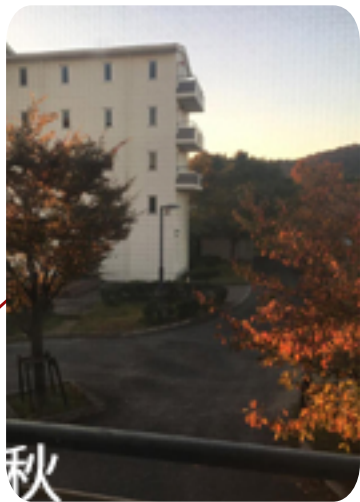
從宿舍房間看出去的景色

宿舍主要有兩個， 山本宿舍（位於高安）和柏原留學生宿舍（大教大本部）， 還有個天王寺， 但不是大學部的。 山本宿舍是 3 人一住宅單位， 每個人都有自己的房間。 通常是給日研生住， 位於市區， 地點比較方便， 但相對比較貴。 柏原留學生宿舍， 在山上， 四層樓， 單人房， 有廁所 + 冰箱 + 衣櫃 + 書桌。 廚房和浴室每層共用。