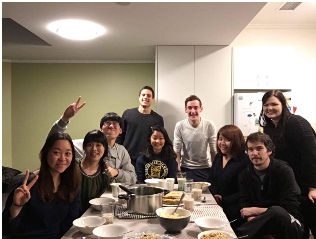
和一群歐美交換生完成三天兩夜的 road trip