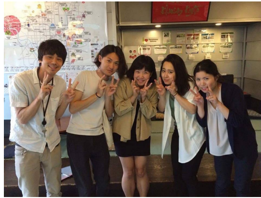
暑假偷偷回訪考山，被大家抓住拍照

年初的長假，我到京都的考山背包客棧打工換宿，這邊除了提供住宿，也給薪；一個月下來減掉住宿費居然還賺了6萬日幣，立刻補足我暑假想周遊日本的資金。在考山換宿期間也交了很多外向的日本朋友，回國後都還有聯絡！