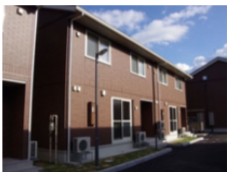
先魁的小木屋群俗稱「先魁度假村」

住宿方面，交換生會被分配到專屬交換學生的宿舍；我這屆可以選擇的有先魁和國流。國流是單人房，離學校比較近，房內有狹小的衛浴、廚房和陽台；先魁則是八人一棟兩層小木屋，各自有一間房間，兩層樓有兩套衛浴，廚房共用，也有共同的飯廳空間。