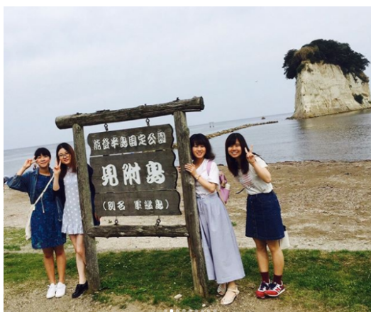
如果沒開車，很難到能登半島啊

我最後選擇住先魁，雖然要平分公共空間的電費和水費，租金較貴，但是設備新很多。另外，鍋碗瓢盆、打掃用具、電視（看哪間）等，都不用再自己重新買，可以省下一筆不小的開銷。