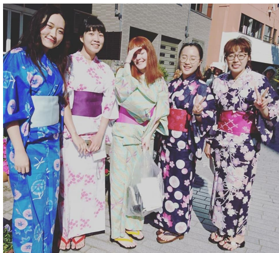
文化選修課，可以免費體驗穿浴衣的選修課

但不用擔心交不到日本朋友！每個交換生都會配到一位日本人Tutor，Tutor 除了可以教你日文，如果生活上遇到什麼難題都可以向他／她求救。