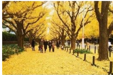
隨便曬兩張玩樂時的美景照

到日本交換一年，學了日文、體驗不同文化、更成熟獨立，還圓了不少個人夢想（瀨戶內海藝術祭、FUJI ROCK、滑雪等），收穫良多，充滿感謝！