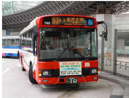
就是搭這班公車去車站！

交通費也相當驚人，去車站來回就要700日圓，單純下山來回也要400日圓左右。很多人都會買一台二手腳踏車代步，除了上課方便，去山下也省錢。