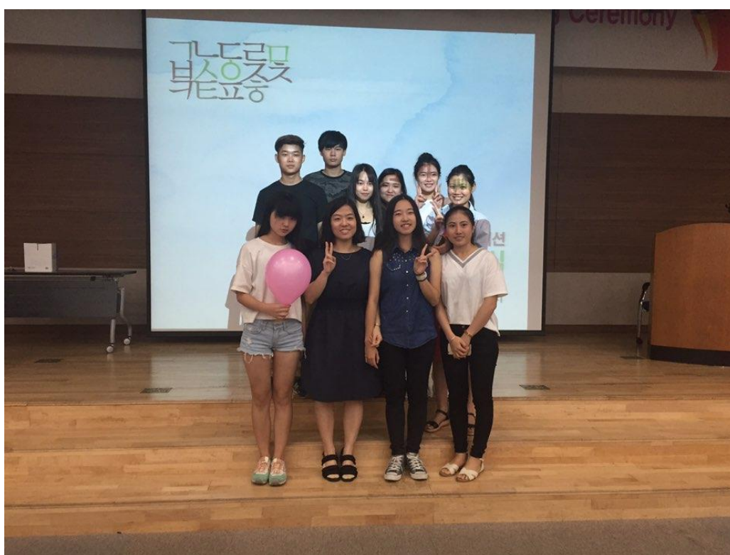
語學堂三級班 結業式