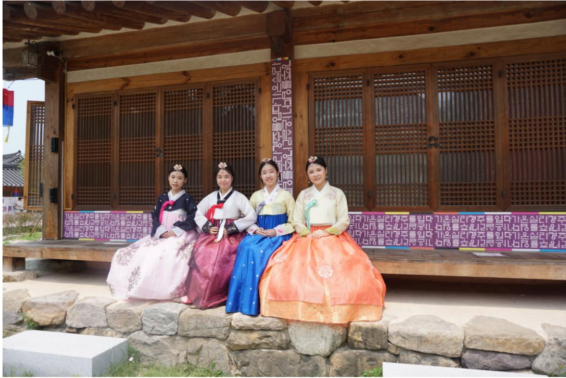
與中國朋友的韓服體驗