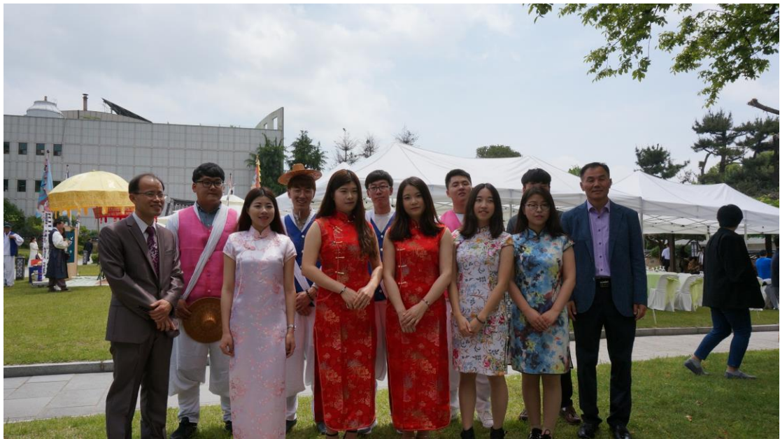
應老師要求穿著旗袍參加婚禮