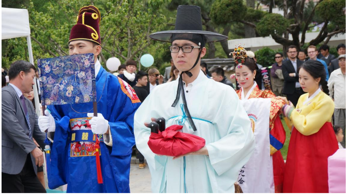
參加韓語老師的傳統婚禮