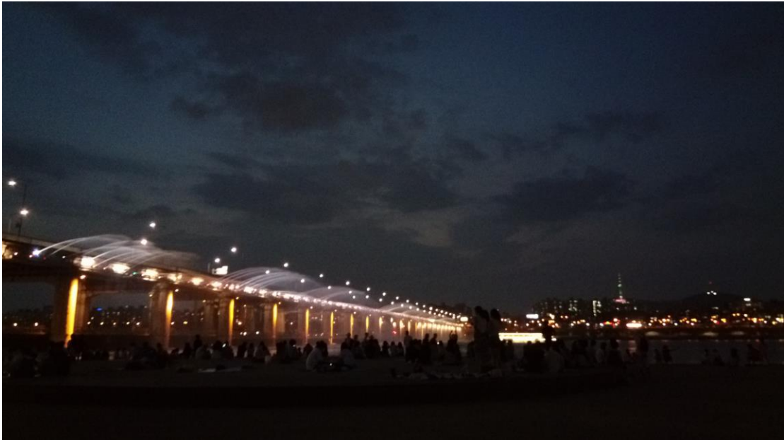
獨自去首爾旅遊 盤浦大橋