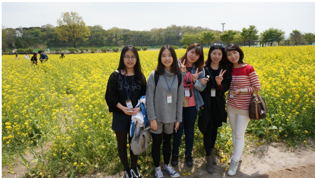
語學堂二級班 文化課慶洲出遊