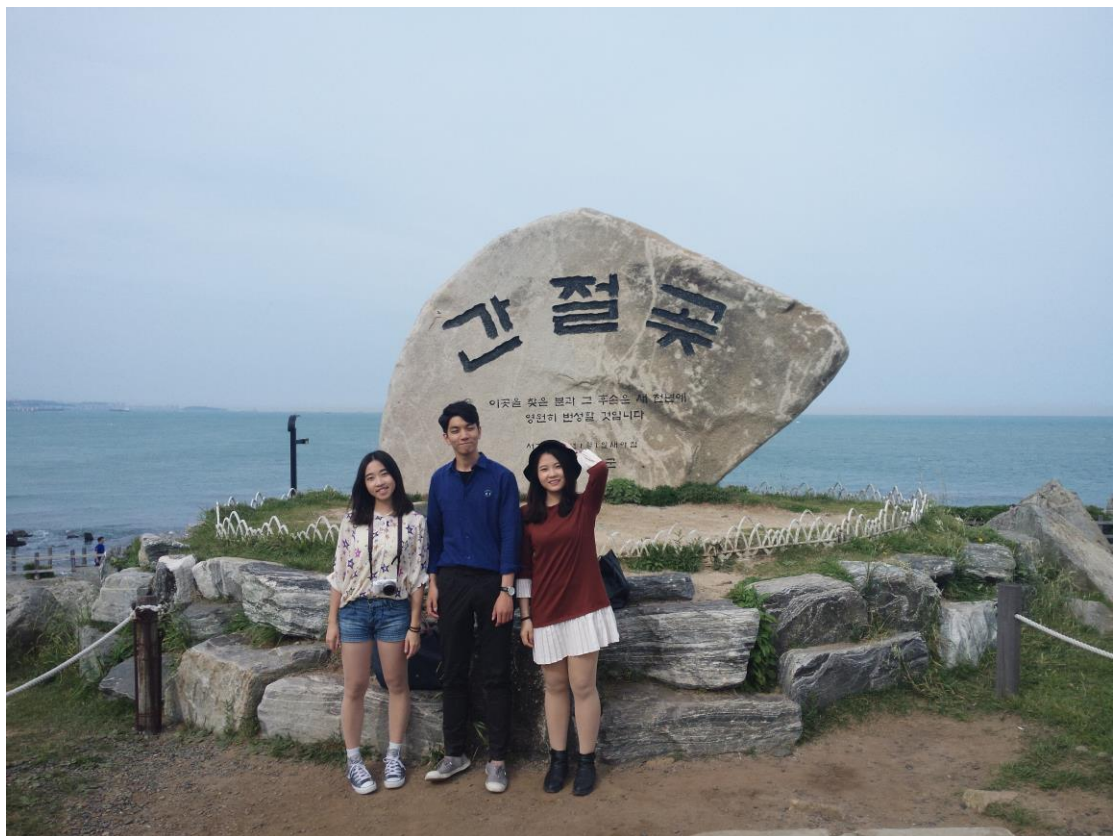
與韓國朋友及中國室友出遊