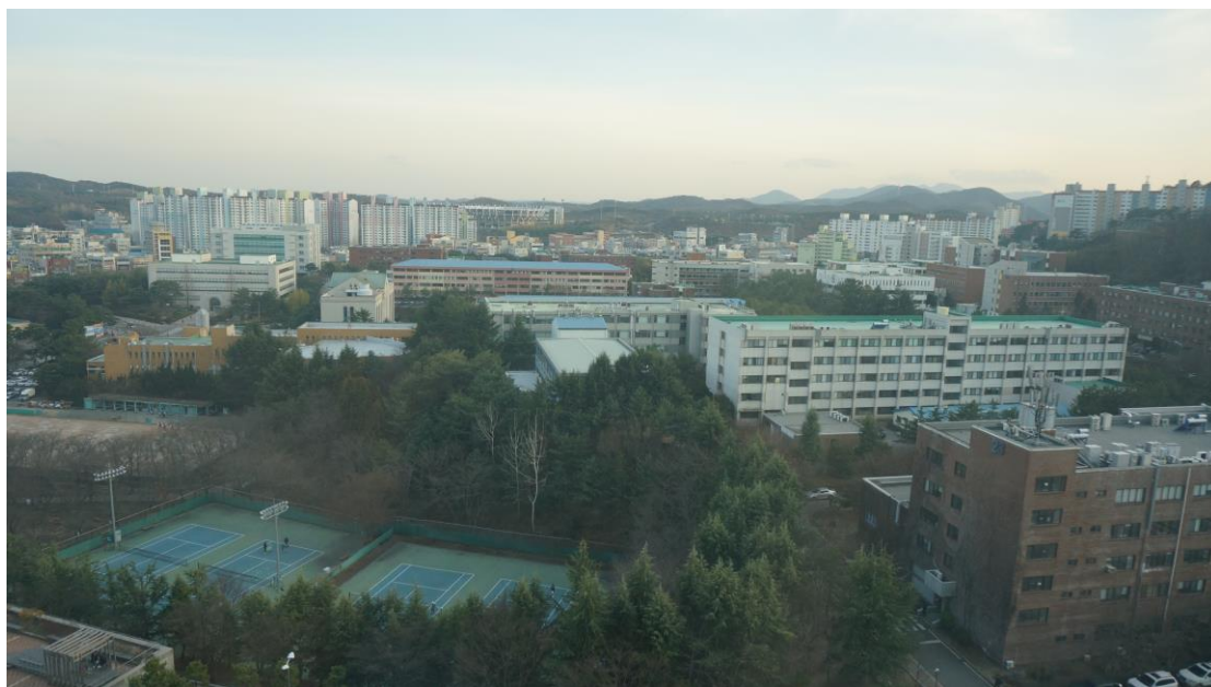
從 10 樓宿舍看的蔚山大學