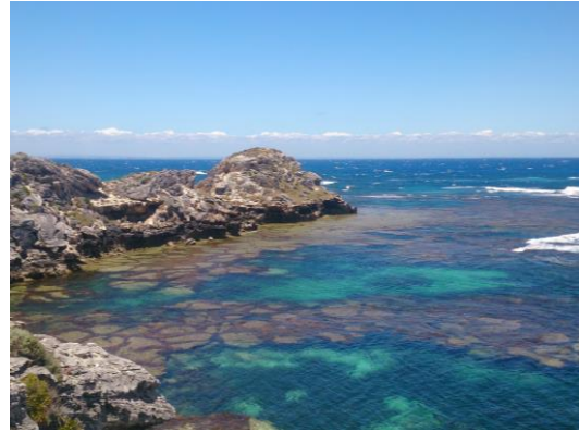
騎腳踏車環 Rottnest 島欣賞夢幻島嶼風光