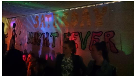
學期初宿舍舉行的 party