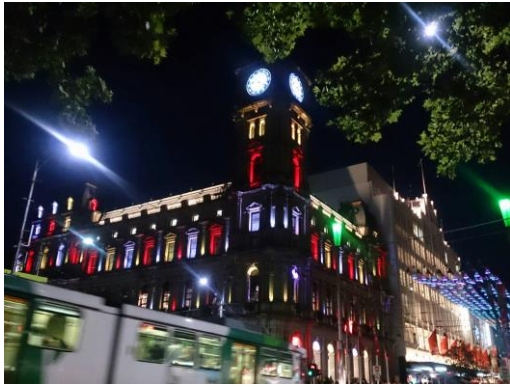
墨爾本市區絢麗的夜景

交換生活中，除了校園生活外，旅行也是另一項很有收穫的寶貴回憶，ANU上課時間比起臺灣相對較短，期中有兩個禮拜的 mid break，期末課程結束後，最後三週不上課為溫書及考試的 exam period。