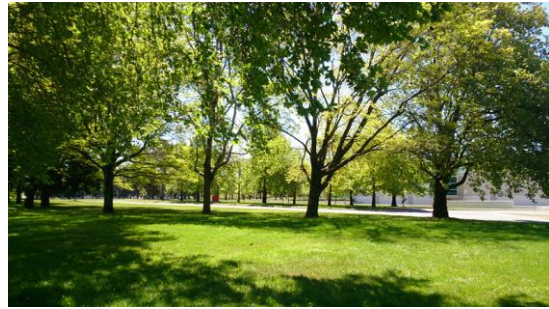
右側兩張皆為 Lake Burley Griffin 湖邊景色