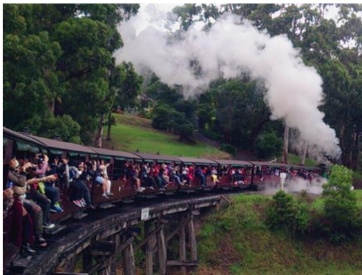
維多利亞州的蒸汽火車 Puffing Billy