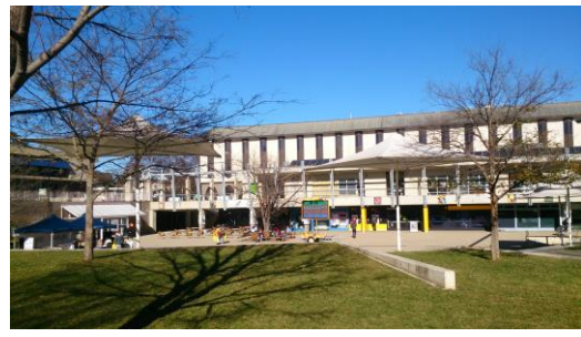
校內最常舉行各式活動 Union Court