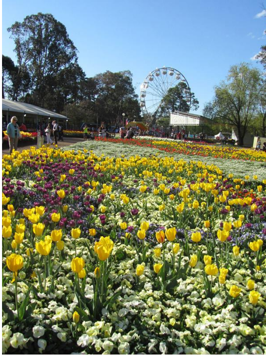
Canberra 九月春季 Florida 百花盛開之美