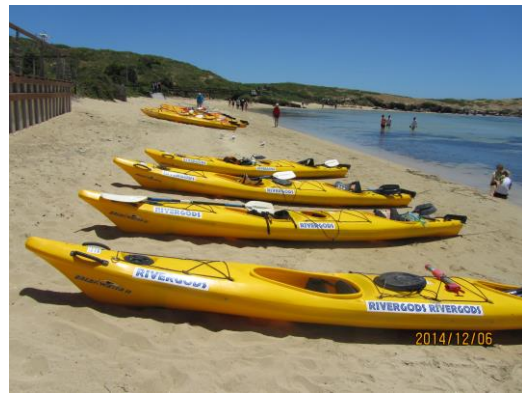
在西澳划獨木舟 一路上邊划邊賞海豚!!

在遼闊的澳洲，每到一個地方都有不同的感受。在恬淡的 Canberra，ANU 及宿舍 B&G 的美好體驗讓我難忘，我也把握期中期末的時光走過繁華熱鬧的 Sydney，山海城鄉並存的時尚 Melbourne，度假冒險的 Cairns，陽光熱情的 Brisbane，壯麗又神祕的 Tasmania，開朗美麗的 Adelaide，悠閒又優雅的 Perth，以及澳洲大陸西邊夢幻又讓人驚艷的 Rottnest Island。雖然最後無緣親自體驗北領地荒漠的原住民傳說以及紐西蘭令人驚艷的自然風光，但是難得有機會踏上這麼多個澳洲城市我已經非常珍惜，最重要就是懷著一顆開朗與期待的心，迎接每一段旅行的風景、享受每一個城市的特色、把握每一段旅行所遇到的人們，親自寫下自己在澳洲的故事。