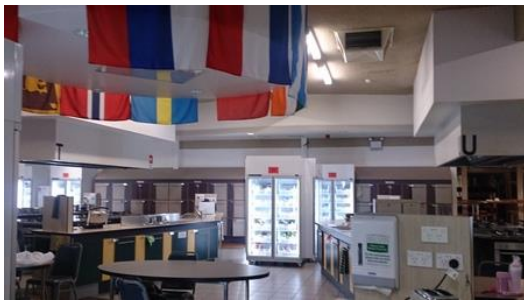
B and G 共用的大廚房

我很幸運的分發到位於校內的 self-catered 宿舍 Burton and Garran Hall(簡稱 B&G)，B&G 是一人房，廁所及衛浴為同一層樓共用，每層樓有 Senior Resident(SR)照顧整層樓的人，平時 SR 每週舉行兩次的晚上小聚會、每學期兩到三次 floor party，凝聚同一層的朋友們的感情。即使是一人房，宿舍提供許多公共空間與人互動，如宿舍內的共用音樂教室、電腦室、圖書館、運動空間、交誼廳。ANU 每棟宿舍都是一個很大的社群，有宿舍的幹部、球隊、Academic Team、樓長等組織，有點像台灣的系學會。