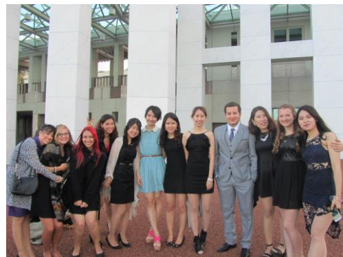
宿舍年度最大的交接暨歡送宴會 Valet

B&G 也是一個很國際化的宿舍，ANU 的交換生大部份住在這裡，宿舍活動多采多姿，開學第一週就舉辦很多 party 歡迎新生，也有各種主題的活動，宿舍生活忙碌又充實。除了 B&G 舉行的各式 party 外，很大的共用開放式廚房也是宿舍最熱鬧的地方，裡面設備齊全，有瓦斯爐、烤箱、微波爐、烤麵包機、電子鍋、鐵板等共用設備，每個人分配到一格可上鎖的個人冰箱空間以及一個置物櫃。在廚房能夠認識來自不同國家的朋友們，一起下廚的時間就是最輕鬆愉快的時光，煮好後在餐桌與往來的人群打招呼、聊天、一起吃飯。每過一段時間與好友們一起舉辦 potluck，每人準備一兩到菜色，大家聚在一起的時光總是很快樂，經過一學期每日煮飯的生活，廚藝進步也是交換額外的收穫吧！