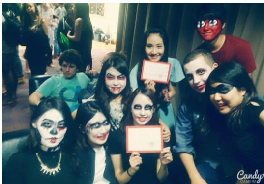
與宿舍朋友們一起盛裝打扮慶祝萬聖節