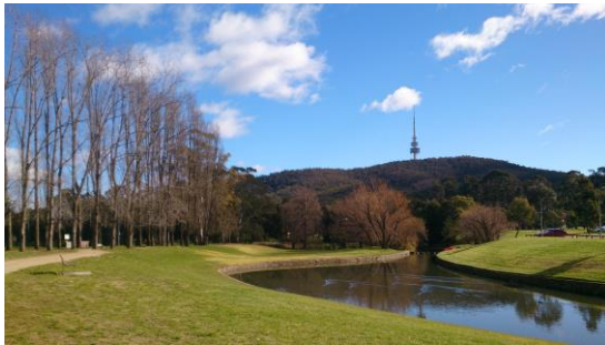
校園一景，遠處為 Telstra Tower