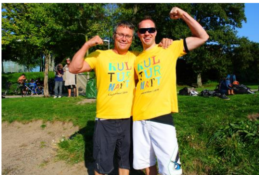
文化之夜輕艇工作人員