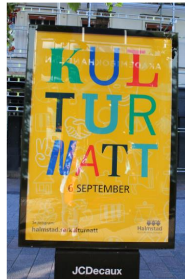
文化之夜宣傳海報

筆者交換的學期是下半年，在瑞典停留期間從九月到隔年二月，經歷了幾個瑞典當地特有的節慶。九月初首先是瑞典各大城市都會舉辦的文化之夜(Kulturnatten)，在這一天在城市的各個角落會架起數個舞台、帳篷和各種 booth，提供給市內的各類文化組織和群體一展示平台，當中除了當地劇院、樂團、獨立商店等等之外，也有中國書法、伊斯蘭文化等等的展示攤位。活動主辦單位不僅與市內所有文化機構包括圖書館、劇院、電影院、學校等等合作，也同時和消防局、警局等等配合，將消防和警用裝備帶到會場，和當地孩童互動，增加居民參與。戶外活動部份由於 Halmstad 市中心有河流流經，因此也有輕艇組織到現場推廣，另外也有無數不同音樂類型的露天草原音樂會在市內各個角落同時進行。