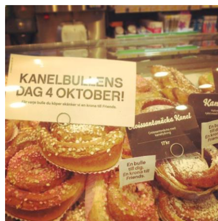
肉桂捲節 超市擺設

十月初則是肉桂捲節(Kanelbullens Dag)，肉桂捲是瑞典當地最普遍且最受歡迎的點心，因此衍生出了這個專屬於肉桂捲的節慶，定於每年的十月四日。這個特殊節慶在1999年由一家烘焙原料坊提出，想要藉一種麵包推廣自家烘焙(home-baking)的概念，因此在向全國各地的烘焙師、學者、居民請益後決定以肉桂捲做為主角。一般每個瑞典家庭都會有自己的獨特配方，在肉桂捲節前夕就會開始準備製作肉桂捲的材料，在節慶當天全家人一起製作肉桂捲 1 。