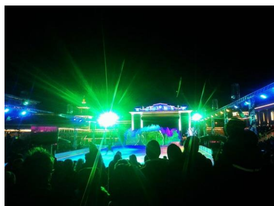
聖誕市集 節目演出