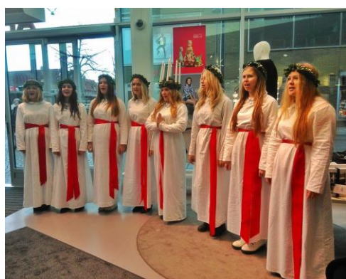
聖露西亞節 合唱團

聖露西亞節則是瑞典的冬至，通常於十二月初，這一天之後白晝就會越來越長，當天在市中心各地會有由聖露西亞女孩組成的合唱團巡迴演出，晚間的最後一場則會在市圖書館演出。當天瑞典各地的教堂也都會有聖露西亞節相關的音樂會或文化活動。