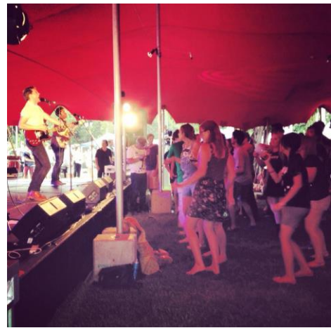
Orientation Concert at GP