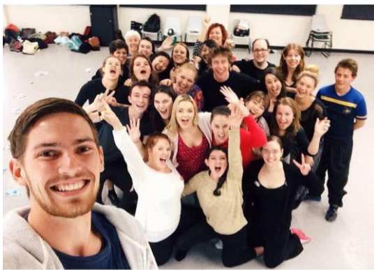
Process Drama Workshop Group