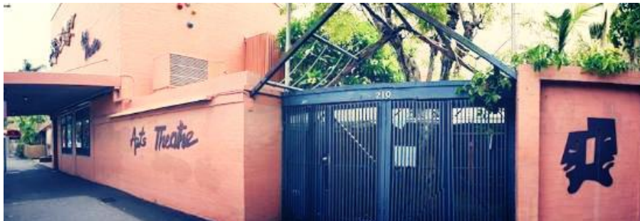
Brisbane Arts Theatre (Where I work as volunteer)