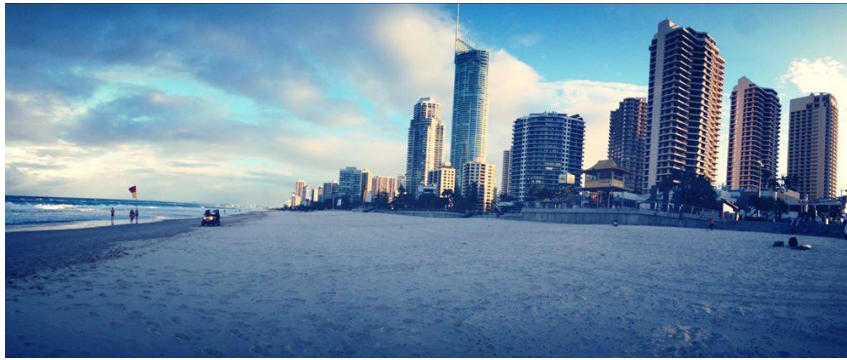
Gold Coast Surfers paradise