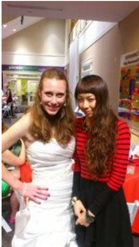
剛好遇上同學姐姐結婚。