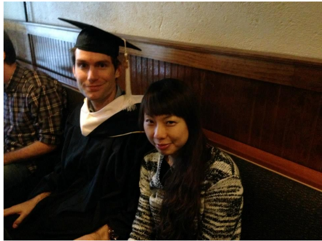
參加同學的畢業慶祝。