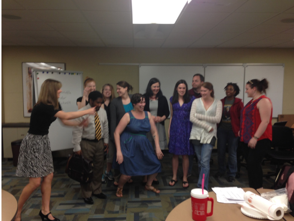
我的同學及老師(中間藍色洋裝半蹲)很可愛。