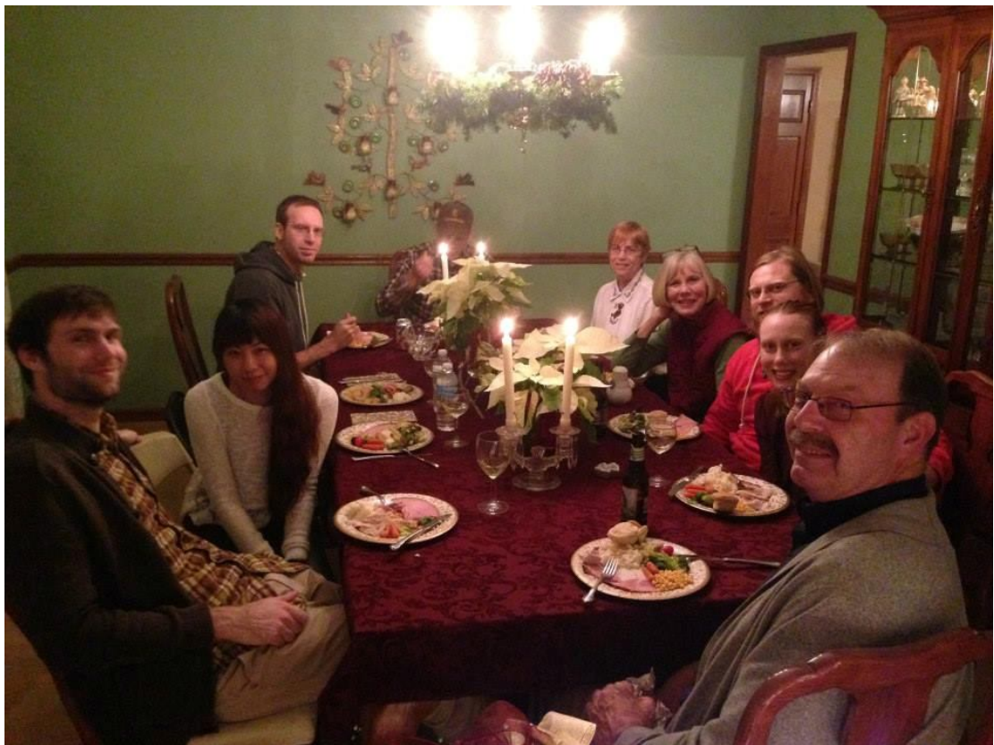
聖誕節就如同台灣的過年，是美國最重要節慶，很開心可以到同學家一起用餐。