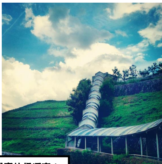
大阪教育大學真的很漂亮！