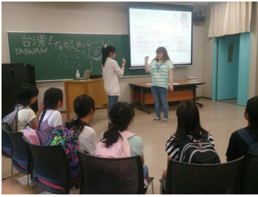
文化交流週 教小學生 認識台灣