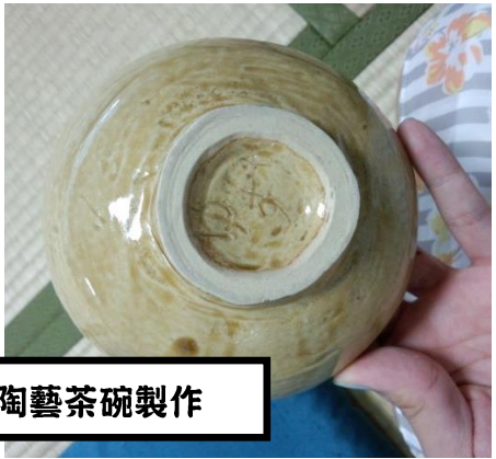
日本傳統文化：劍道、三味線、陶藝茶碗製作