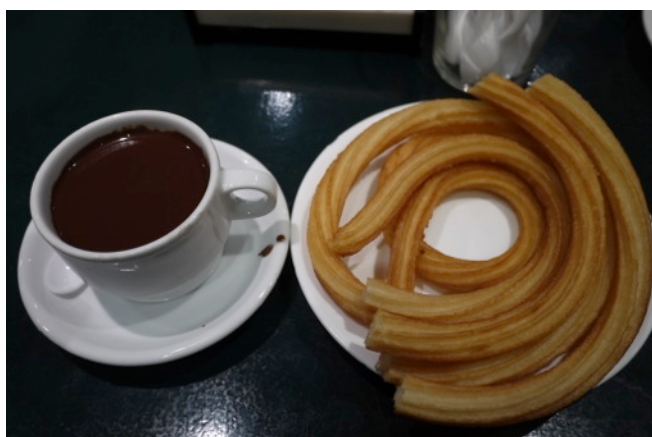
〈西班牙甜點 churros con chocolate〉